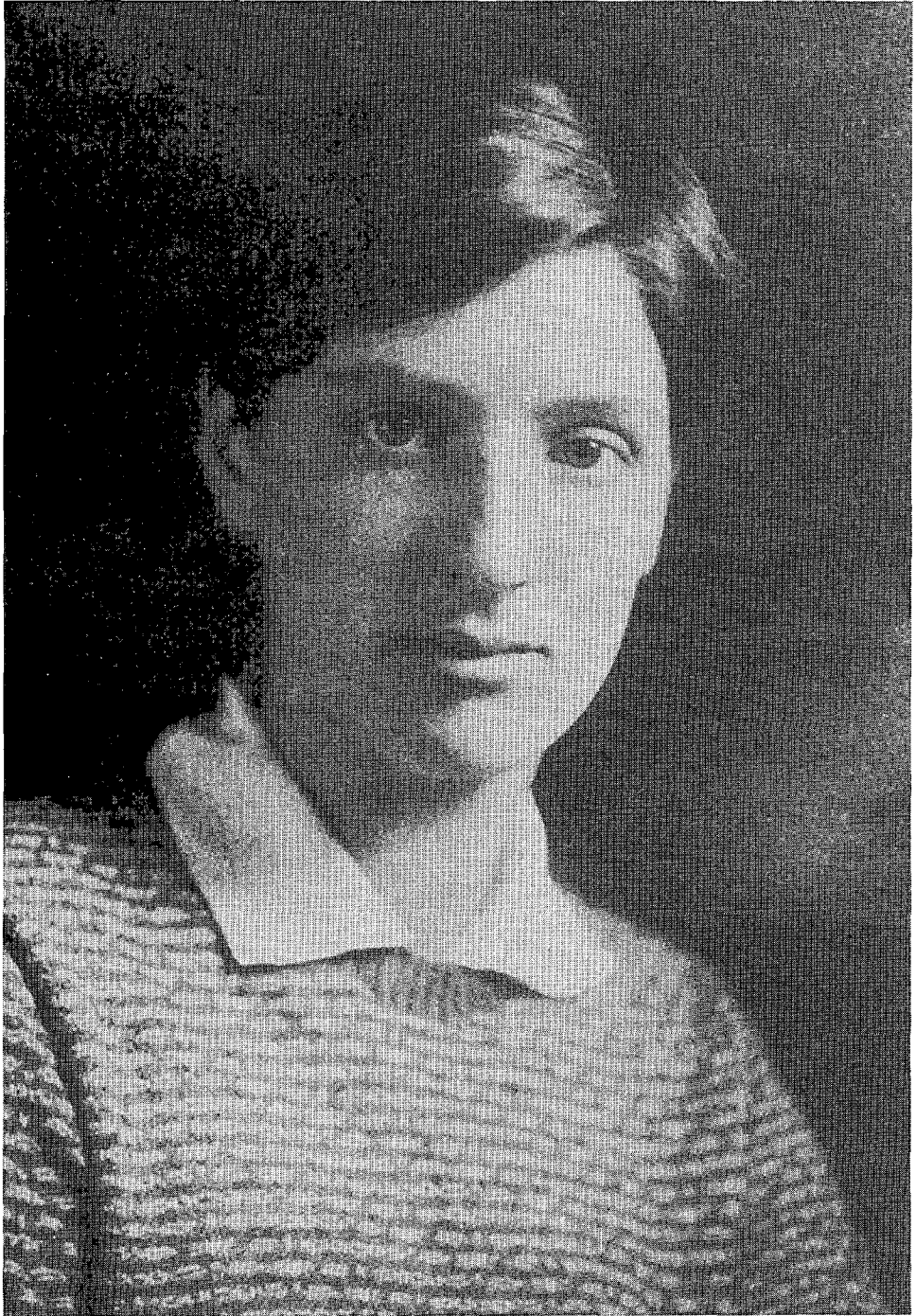
May Sarton (Uit M. Sarton, I Knew a Phoenix, 1995)