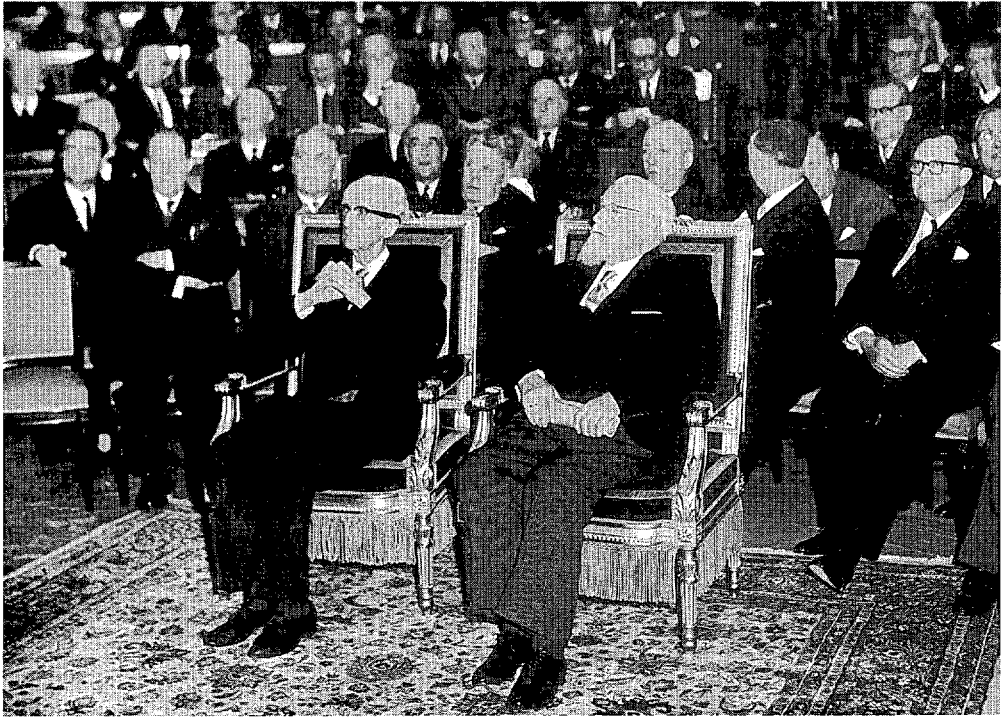
Viering van het 50-jarig parlementair mandaat van Huysmans en Van Cauwelaert, 1960