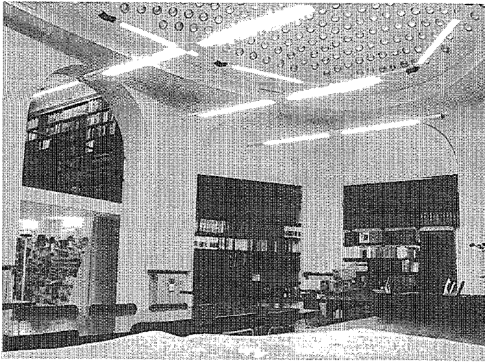
De leeszaal van het Feltrinelli-instituut (uit Giangiacomo Feltrinelli Foundation. A Guide, 1998)