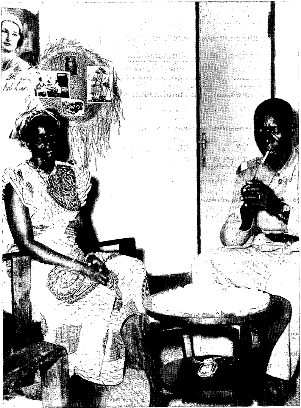
De sociaal-economische en de politieke opties van het Belgisch koloniaal regime hadden geleid tot de vorming van een zwakke en ondergeschikte laag van 'moderne' zwarten of évolués