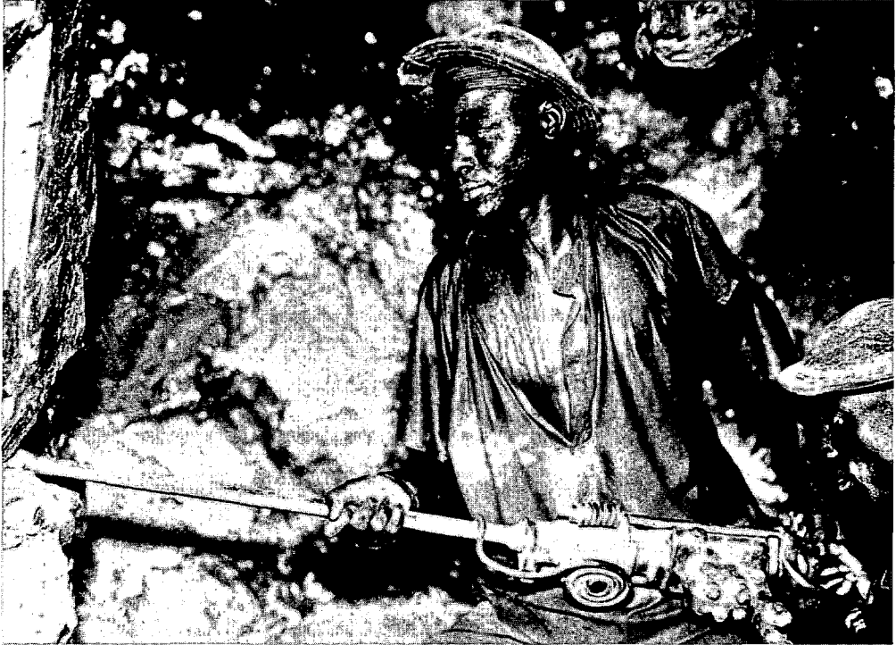
Mijnwerker in de mijn Prince Léopold van de Union minière du Haut-Katanga