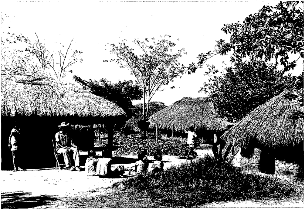
Een 'paysannat indigène' te Shabanza, in de provincie Kasai