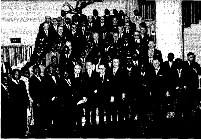
De volledige groep participanten aan de Rondetafelconferentie van 1960

hadden voorgesteld, trokken de socialisten er schoorvoetend en bevreesd heen. De nieuwe partijvoorzitter, Léo Collard, stelde expliciet de vraag: "Il faudrait que l'on sache si nous y allons et si oui, savoir sur quoi portera la discussion. Il faut savoir ce que nous irons y faire" . Pessimisme alom: "Cette Table Ronde sera terrible. Je plains le Parti qui aura le nom d'avoir gâché la question du Congo. [...] c'est une question pire que la question royale. Les PSC ne peuvent cependant nous accuser d'avoir mis de l'huile sur le feu" (Larock, Bureau, 4 januari 1960). Van Acker: "Je pense que l'on va à un échec, devant les revendications des noirs" . Merlot: "Nous sommes victimes d'un mot que nous avons lancé. Nous ne pouvons pas y renoncer. Nous devons y jouer le bon jeu." Collard: "On n'y va pas de gaieté de coeur. Mais, à mon avis, il faut y aller. Le tout est de faire en sorte que ce ne soit pas trop mauvais pour nous" (Bureau, 11 januari 1960).