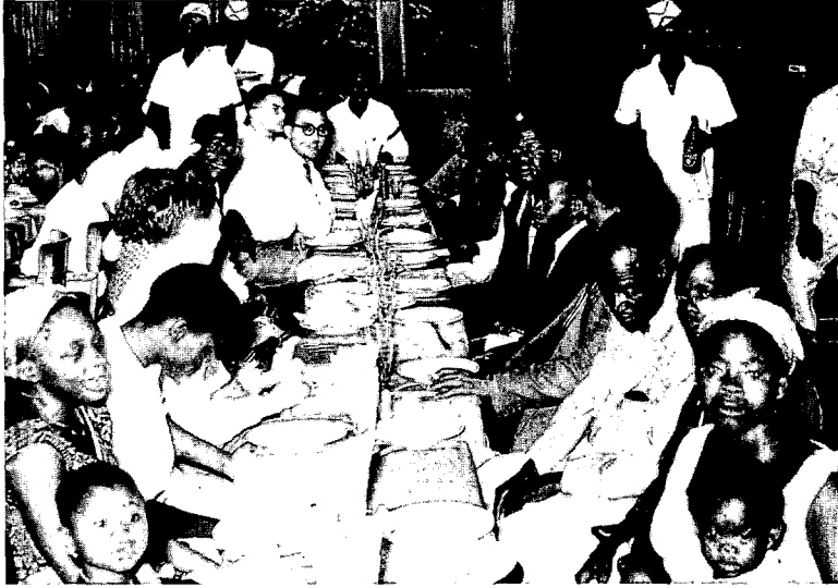
1-meiviering in Leopoldstad in 1958 (collectie J. De Cock)

om "une libre association de la Belgique et du Congo" te verwezenlijken (59) . Al bij al was dit document dus nog vrij gematigd. Men noteert zekere gelijkenissen met het stadia-schema dat het BSP-congres in 1956 had uitgedokterd; alleen werd de lijn hier duidelijker en sneller doorgetrokken naar de onafhankelijkheid die nu met hoofdletters in de tekst prijkte.