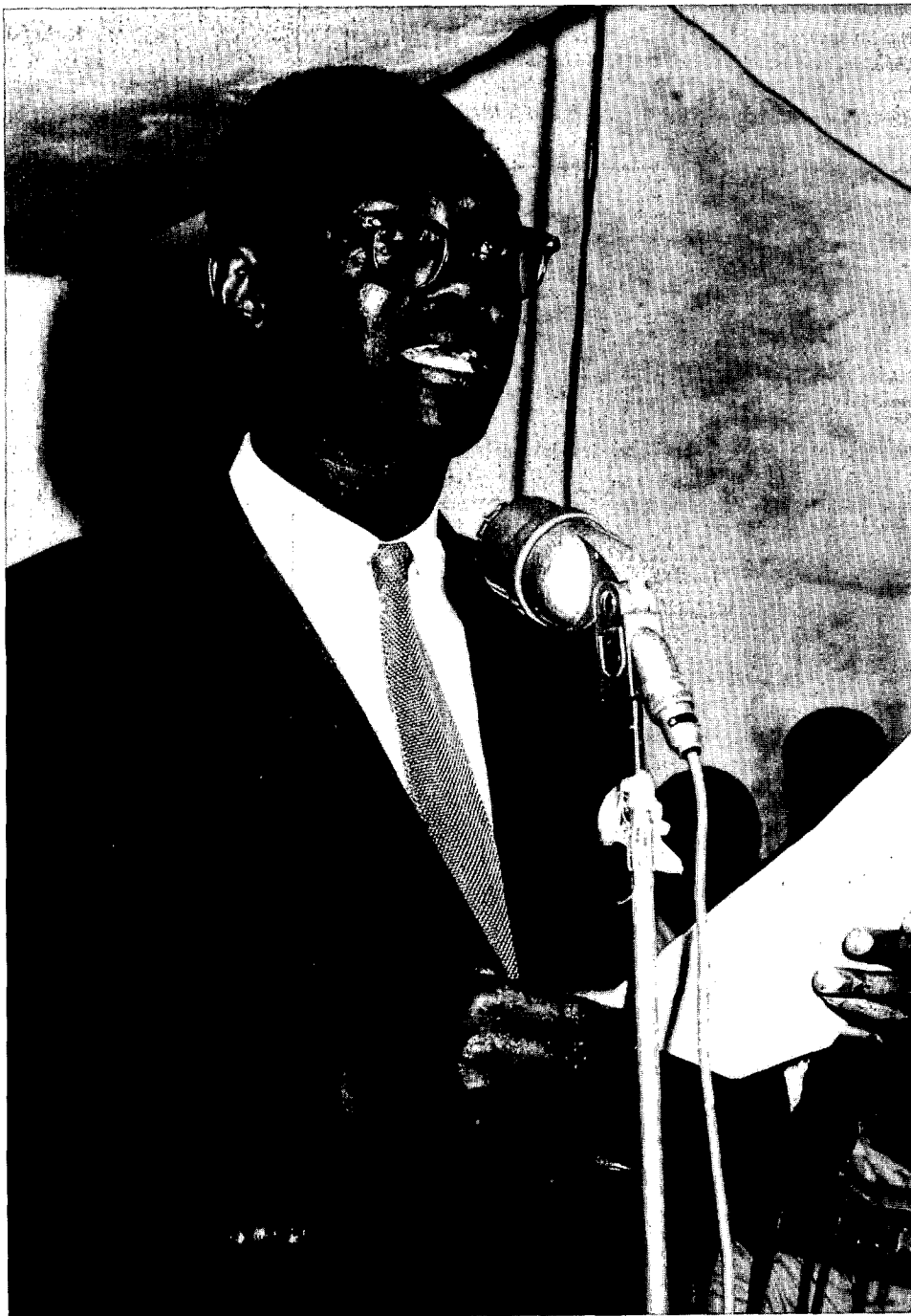
Lumumba, een liberaal? Of een socialist? Of een politicus die steun zocht om uit de gevangenis te geraken en zijn grote politieke zending te vervullen?