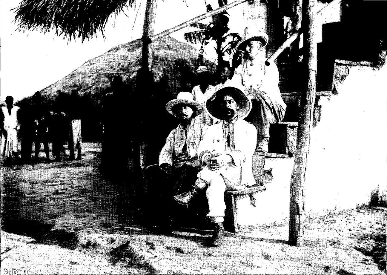
Emile Vandervelde in Congo in 1908