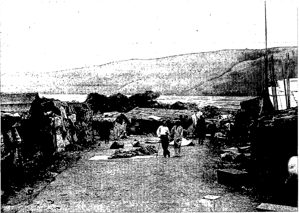
Kamp van Senegalese spoorwegarbeiders rond 1895