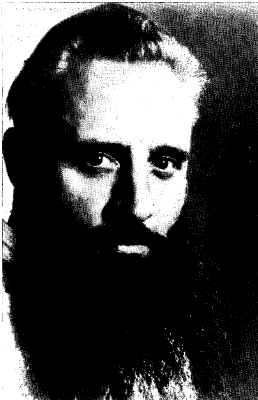
Placide Tempels was niet alleen bezeten van Afrikaanse cultuurfilosofische beschouwingen, maar hij was tevens een sociaal bewogen man