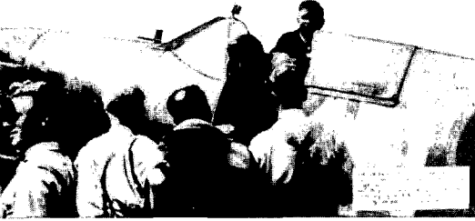
De kolonie heeft zowel militair als economisch bijgedragen tot de oorlogsinspanningen