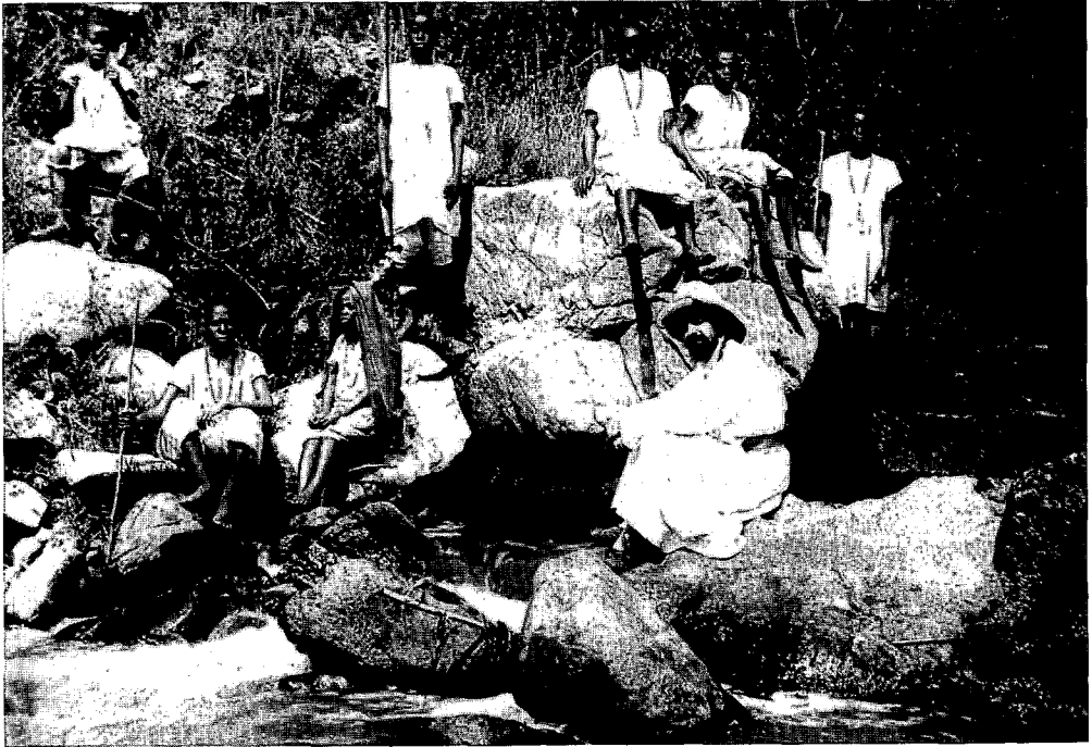
Het is niet overdreven te spreken over de fameuze indirecte macht van de Katholieke Kerk in de kolonie