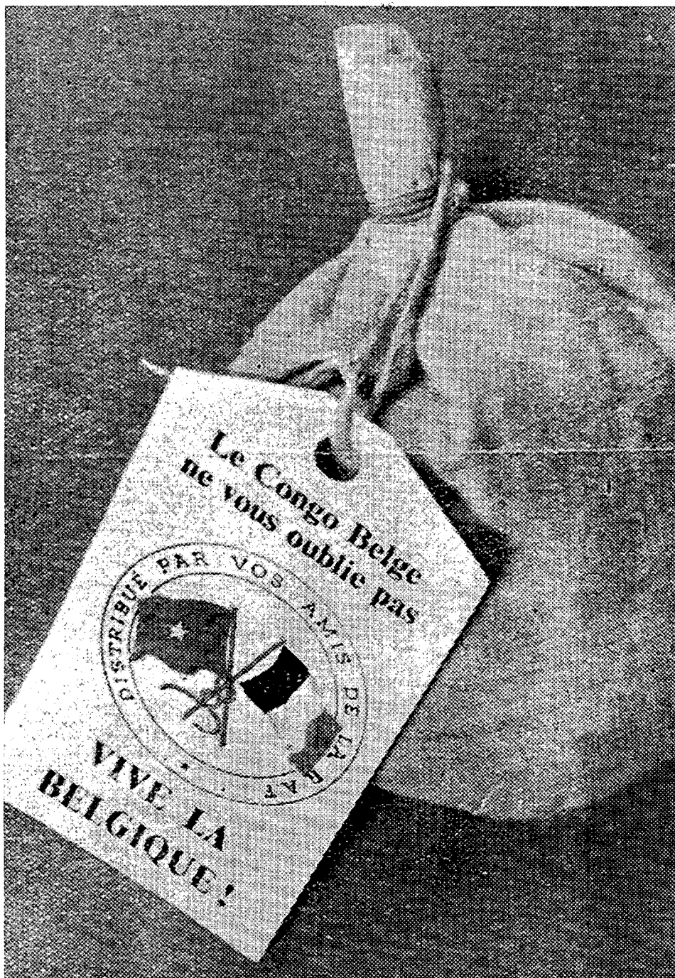
België schaarde zich automatisch aan de kant van de geallieerden en gaf haar kolonie als een soort onderpand aan de Britten