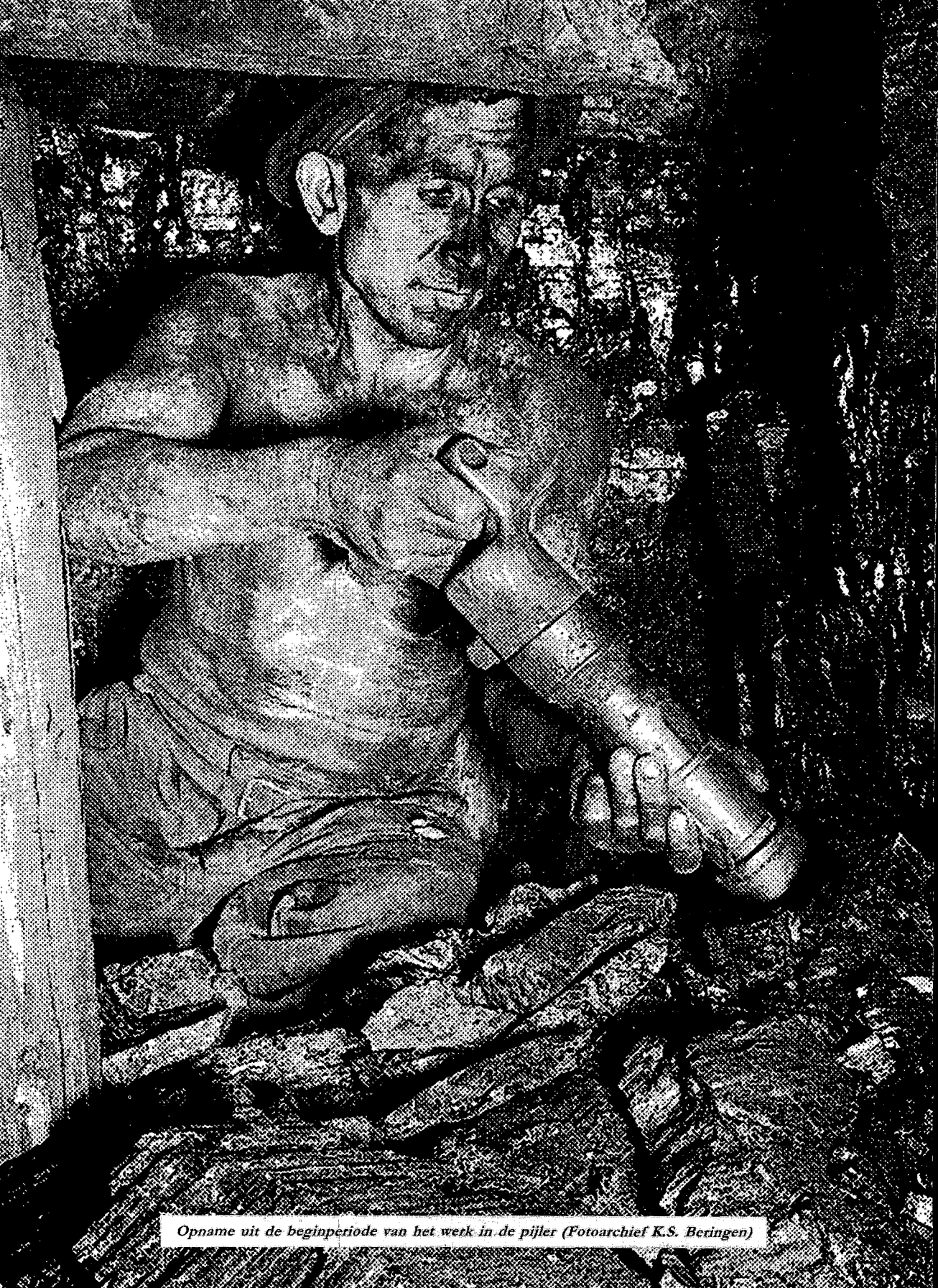
Opname uit de beginperiode van het werk in de pijler (Fotoarchief K.S. Beringen)