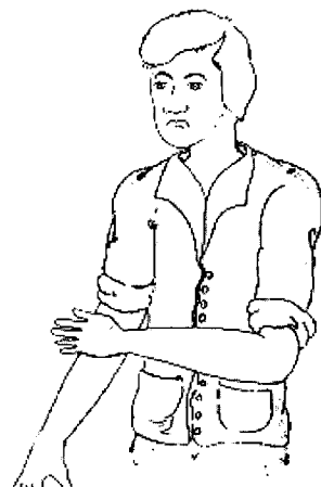
Hij 'kruipt de baas in 't gat', een bij insiders bekend gebaar

imago op te poetsen. In de textielnijverheid werd in de jaren '50 bijvoorbeeld een Miss Katoen het ganse Vlaamse land rondgevoerd om de eigen producten en industrie te promoten. De mijnbedrijven organiseerden begin jaren '60 schoolbezoeken, plaatsten advertenties en maakten propagandafilms om zo kandidaten-mijnwerkers aan te trekken.