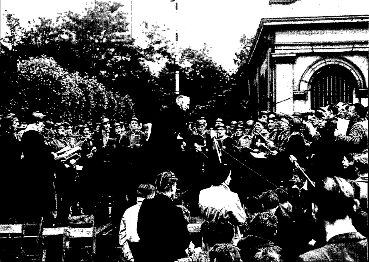
Mijnwerkerskoor in Gent naar aanleiding van het 50-jarig bestaan van de Textielarbeiderscentrale van België in 1948