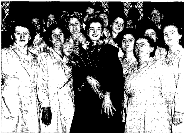
'Miss Katoen' werd in de jaren '50 het hele Vlaamse land rondgevoerd om de producten van de textielindustrie te promoten

besteden. Het zijn twee punten die mijns inziens van dusdanig belang waren dat zij, voornamelijk op het gebied van de sociale verhoudingen, een grote impact hadden.