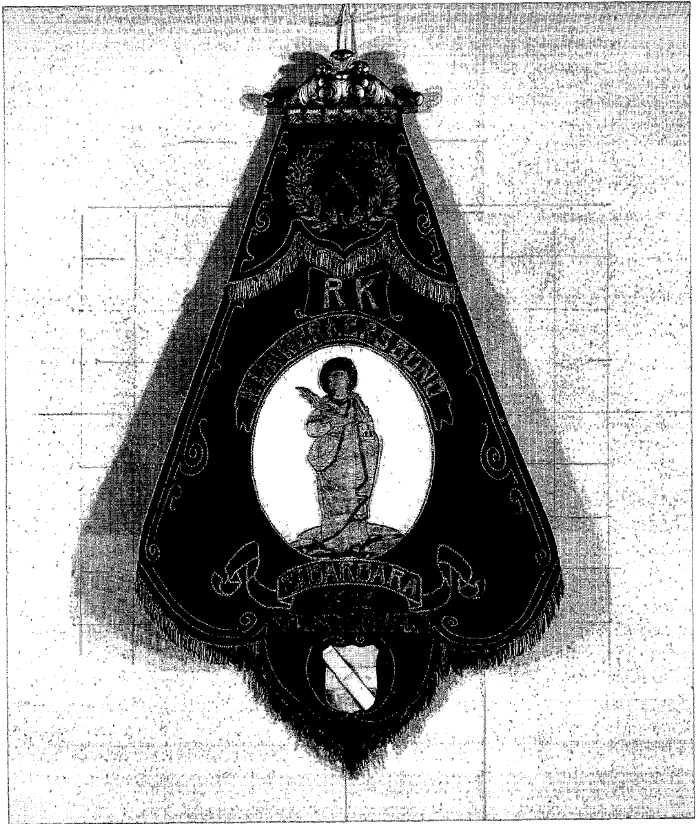
Symbol van respectabiliteit: het vaandel van de in 1915 opgerichte afdeling Schinveld van de Rooms Katholieke Mijnwerkersbond Sint-Barbara. De afdeling kon zich veroorloven het vaandel te betrekken bij een gespecialiseerd bedrijf. Het vaandel toont in het klein de twee hamers die ook het vaandel van een afdeling van de socialistische bond konden sieren. Centraler, groter en kleurrijker is de afbeelding van de heilige