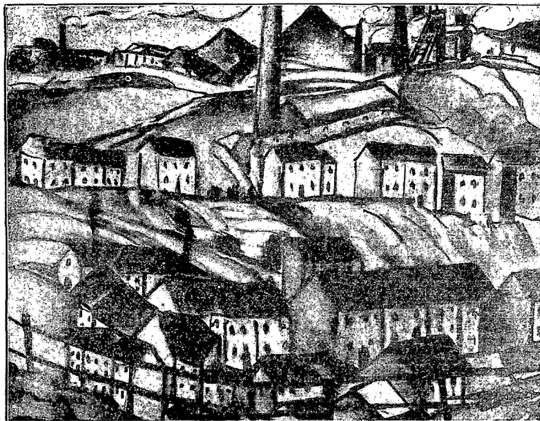
De paleizen der mijnwerkers

'De paleizen der mijnwerkers', een impressie van een mijnwerkersdorp door Else Berg, De Notenkraker, 12 april 1930