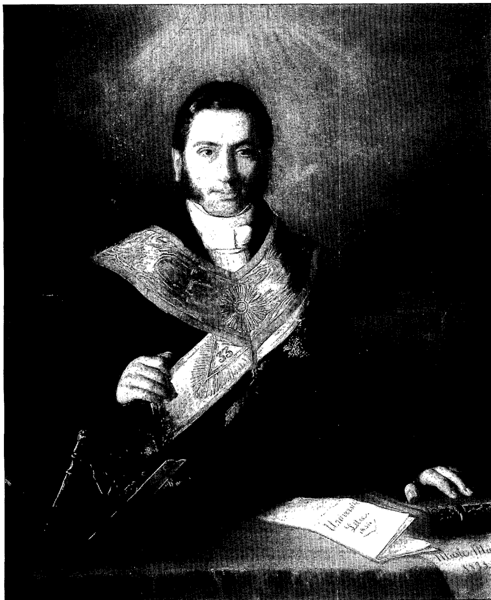
Théodore Verhaegen slaagde erin de Brusselse loges warm te maken voor een vereniging van liberale krachten waaruit in 1846 de Liberale Partij ontstond (Un siècle de Franc-Maçonnerie dans nos régions 1740-1840, CGER, 1983)