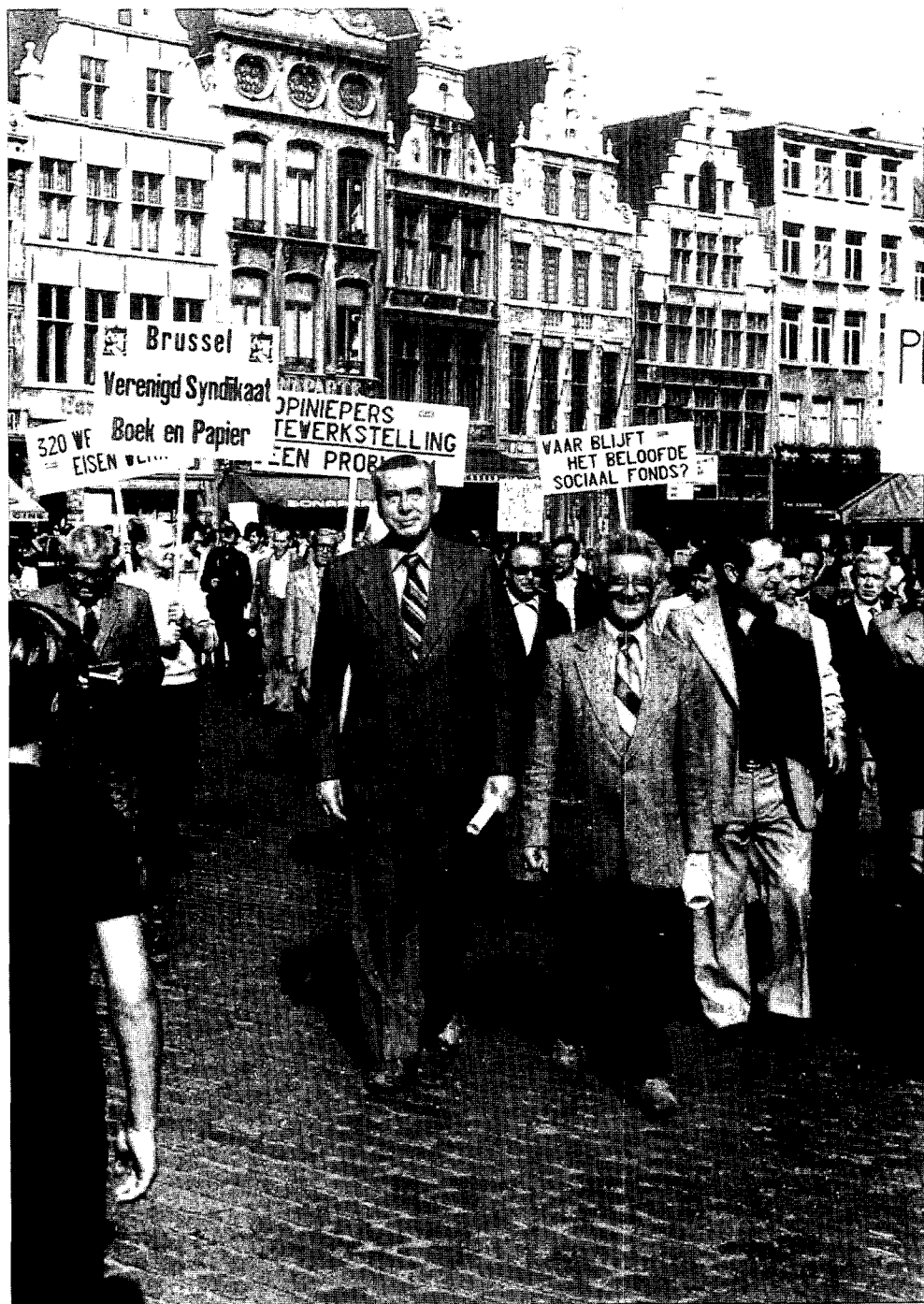
Betoging van de Centrale van Boek en Papier voor de werknemers van Volksgazet