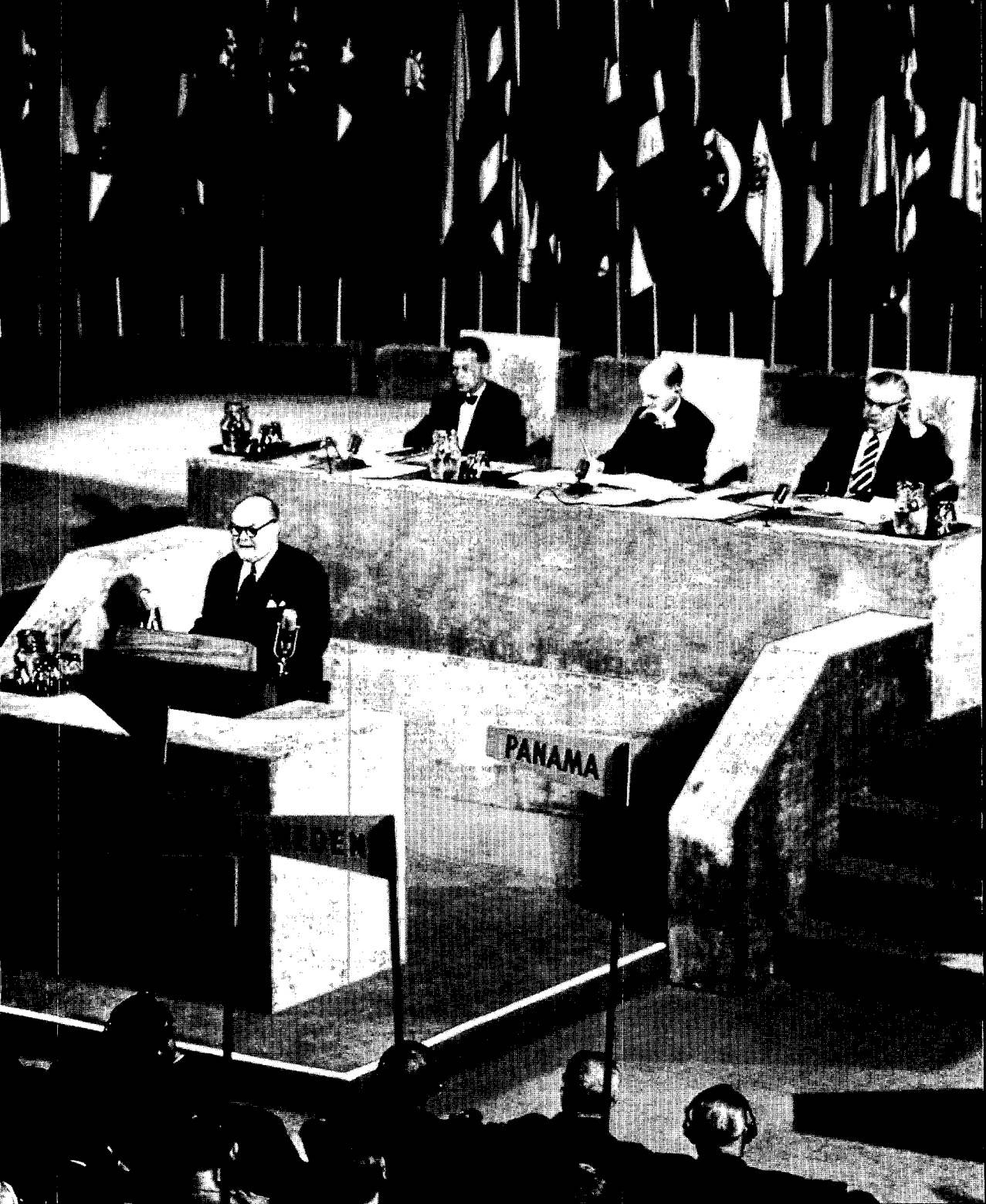
De politicus Spaak wordt vooral geassocieerd met de Belgische buitenlandse politiek