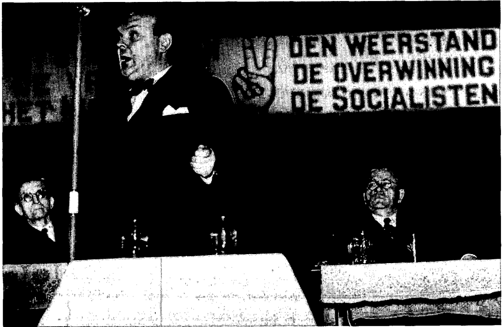
Spaak op een verkiezingsmeeting te Antwerpen in 1946