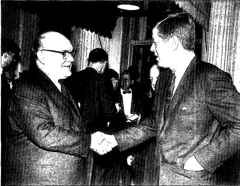
Spaak als minister van Buitenlandse Zaken met president Kennedy van de VS

politieke unie. Spaak hoopte deze ambitie te kunnen realiseren als secretaris-generaal van de NAVO. De interne reacties van de BSP op zijn aanstelling waren veel minder geestdriftig. Spaak begon met grote verwachtingen aan zijn ambtstermijn, maar door de desinteresse van de Amerikanen, de toenemende meningsverschillen met het Frankrijk van Charles De Gaulle en de rivaliteit tussen de Europese lidstaten onderling, kwam er van zijn ambities niet veel terecht. Spaak haakte snel af en begon zich voor te bereiden op een terugkeer naar de Belgische politiek. Toch blijft het merkwaardig dat een ervaren politicus als Spaak soms zo weinig geduld toonde en de politieke gevoeligheden van de verschillende lidstaten zo zwaar onderschatte. De lezer kan zich niet van de indruk ontdoen dat de fut er bij Spaak stilaan uitraakte. Hij was de Belgische politiek en de rivaliteiten en touwtrekkerijen binnen de BSP ontgroeid, maar het internationale terrein had evenmin aan zijn verwachtingen beantwoord.