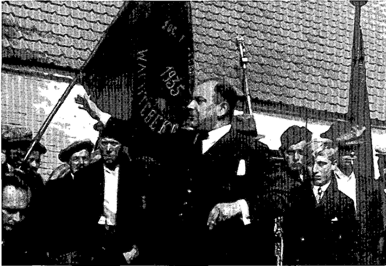
Gust Balthazar, Schepen van Gent van 1923 tot 1934

Het heeft weinig zin deze discussie nog eens opnieuw in detail te ontleden. Balthazar werd ontslaan als schepen tussen de zittingen van 16 mei en 30 juli 1934. Op de agenda van die laatste zitting stond het ontslag van de andere socialistische schepenen bovenaan.