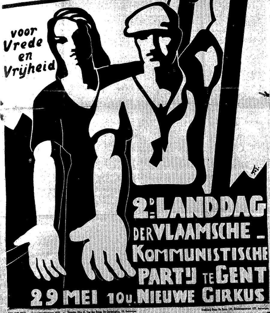
Bij de gemeenteraadsverkiezingen van 1938 werd de eenheid van de KPB met de BWP gepropageerd.