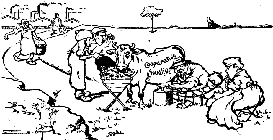
Karikatuur van de socialistische coöperatie in Vers L'Avenir