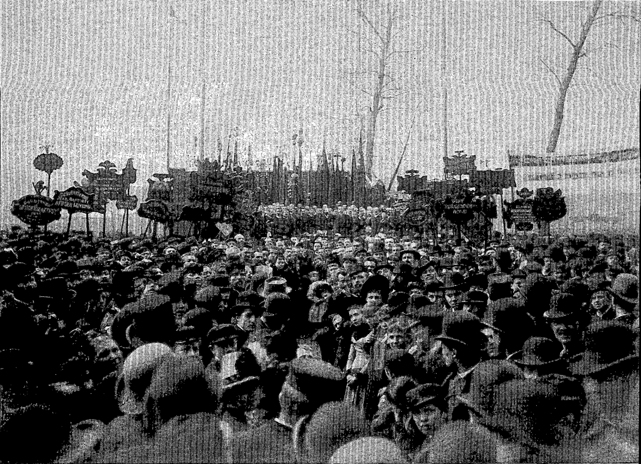
Inhuldigingsfeest voor de nieuwe bakkerij van Vooruit aan de Nijverheidslaan, 1889