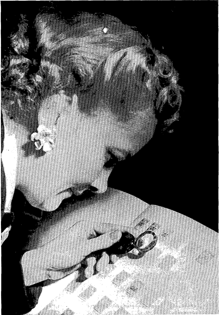
De genderfactor zou van beslissende invloed zijn geweest op de geschiedenis van het postzegelverzamelen