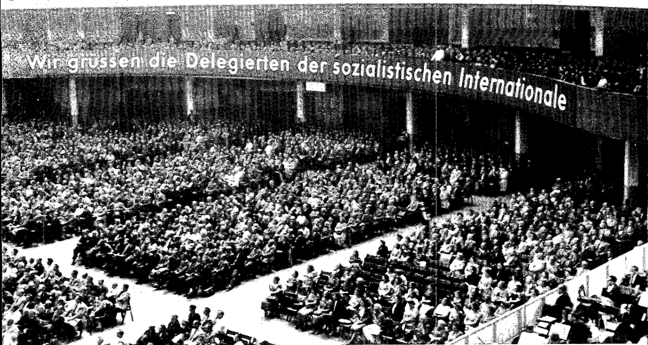
Internationaal Socialistisch Congres te Frankfurt, 1951