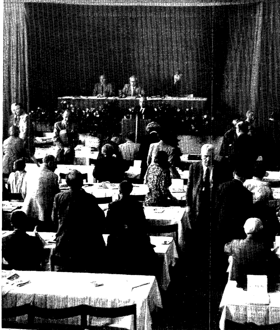
Internationaal Socialistisch Congres te Frankfurt, 1951 vlnr. Braunthal, Ollenhauer en Phillips

Die Internationale wird die Menschheit sein The International unites the human race Et L'Internationale sera le genre humain