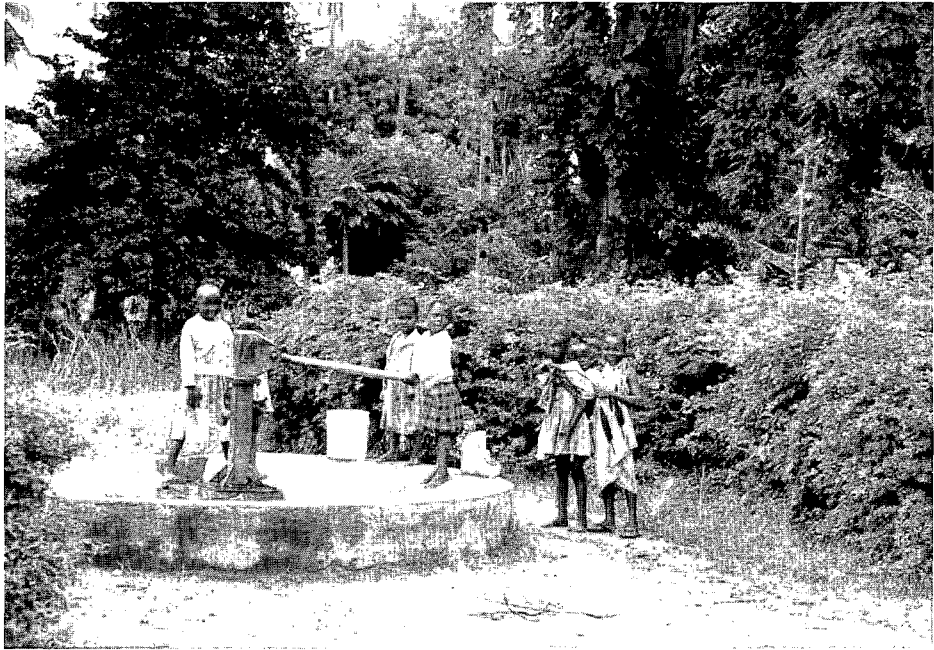
Waterdragers in Tanzania: hulp bij het huishouden of kinderarbeid?