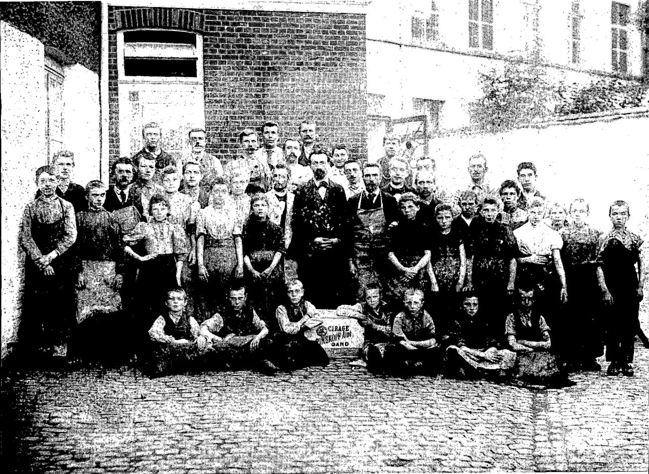
Werknemers van de fabriek 'Cirage Pinskopf' te Gent. Velen onder hen zijn kinderen