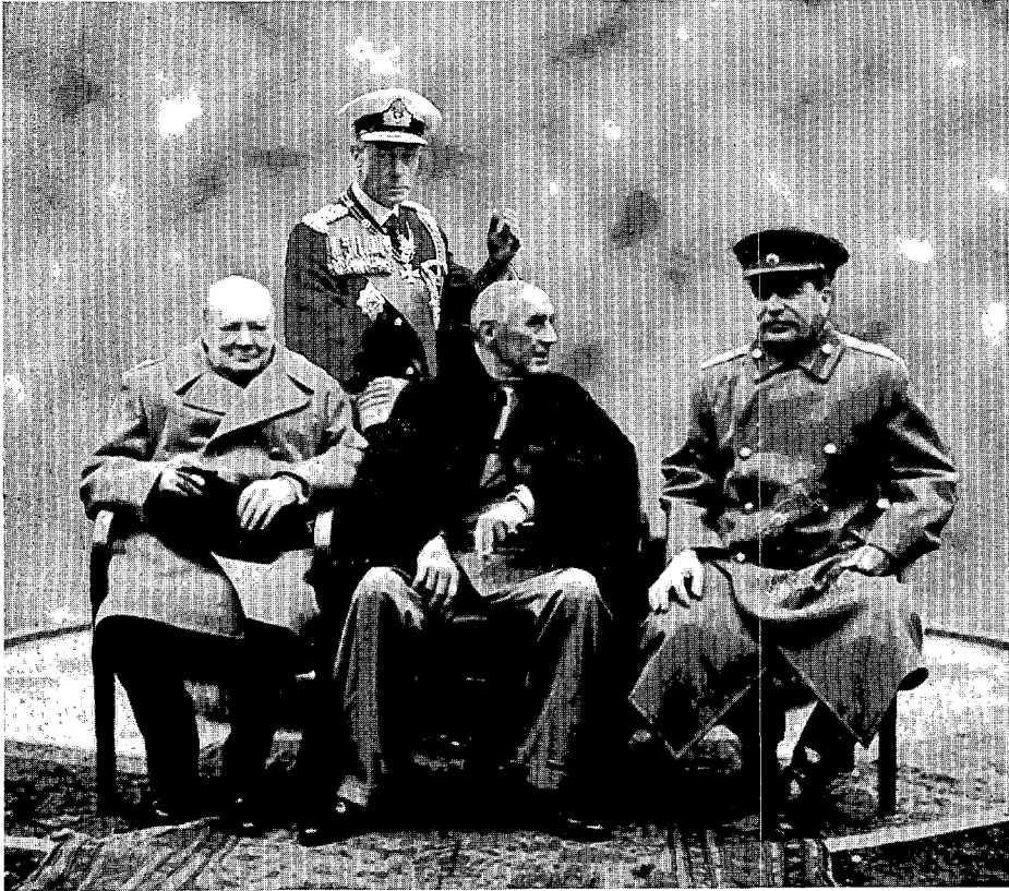
"Long live the King, Churchill, Stalin and Roosevelt". Uitspraak van een anonieme Britse spoorwegarbeider in de Railway Review van 5 september 1914, geciteerd door V. Silverman in zijn boek (montage)