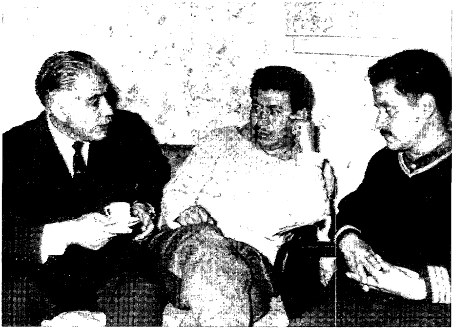
Juan Lechín (l.) in gesprek met leiders van de mijnwerkersvakbond, 1963