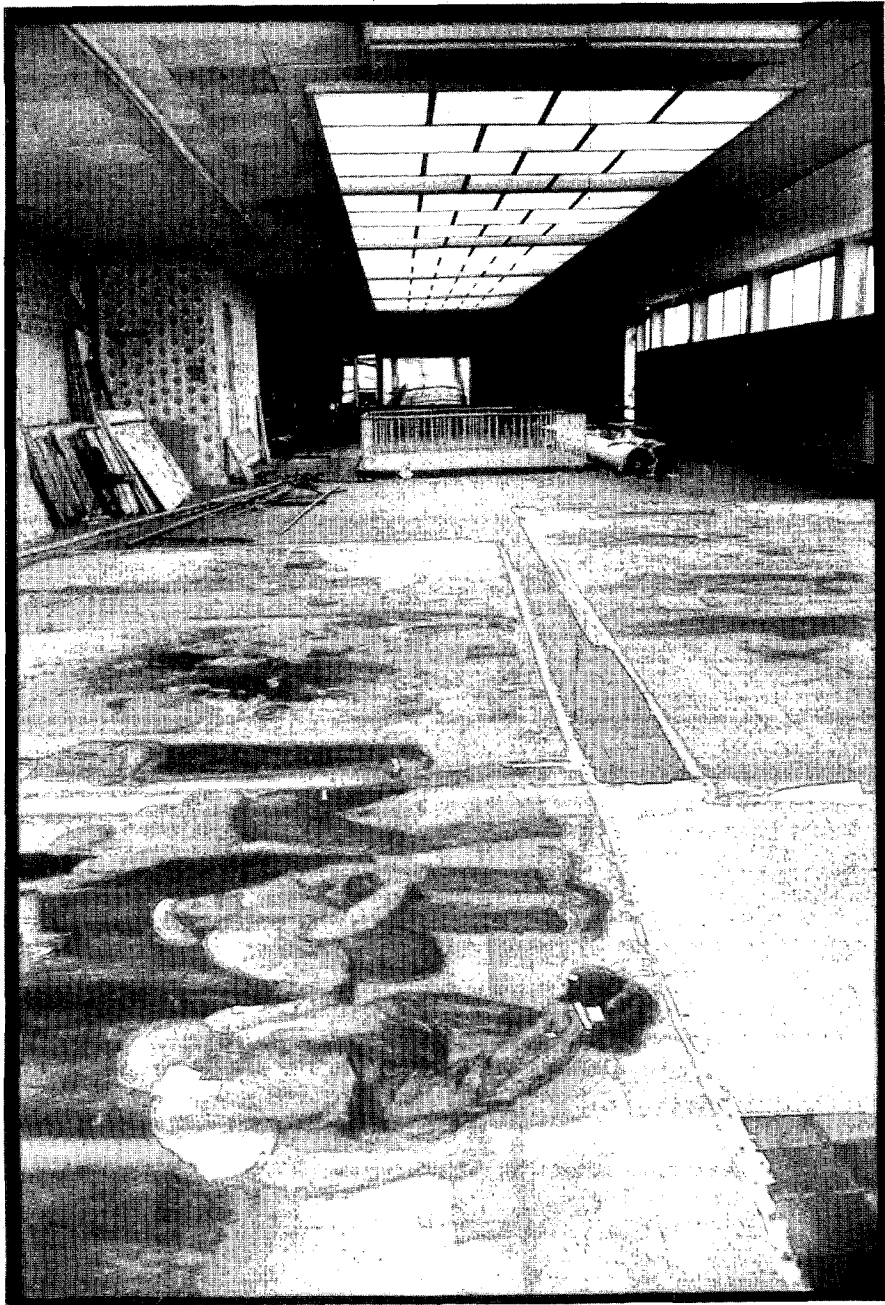
Vooruit tijdens de verbouwingen