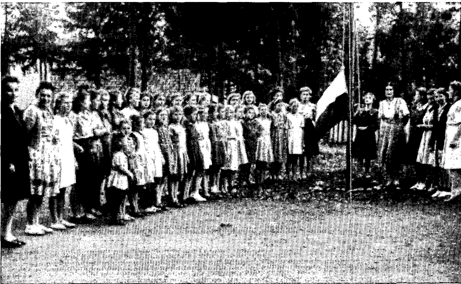
Het appèl in een vakantiekolonie van Poolse meisjes uit België in de villa Jasna in Zakopane (Tatra-gebergte, Zuid-Polen), juli 1948 (Warschau, Archiwum Akt Nowych, ministerie van Onderwijs, sign. 3905)