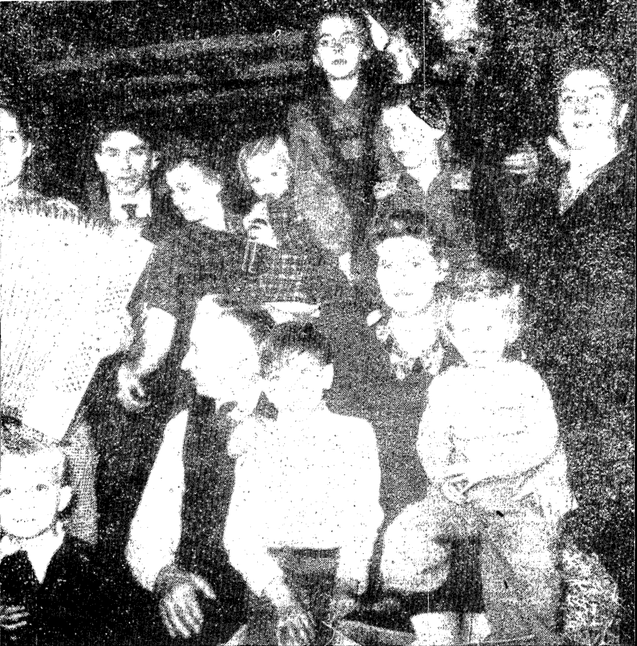
Poolse migranten in België net voor hun vrijwillige repatriëring naar de Poolse volksrepubliek (Polska Dzisiejsza, 15.09.1946,)