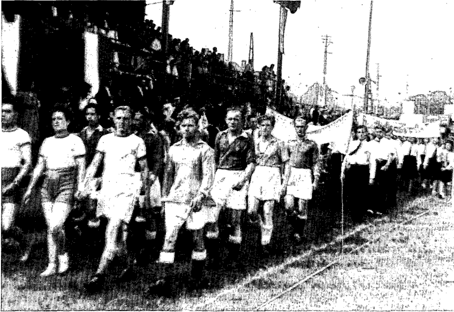
Défilé tijdens de 'zlot', een jaarlijkse sport- en cultuurmanifestatie van de Poolse migrantenjeugd in België en Luxemburg, 1947 (Warschau, Archiwum Akt Nowych, ministerie van Onderwijs, sign. 447)