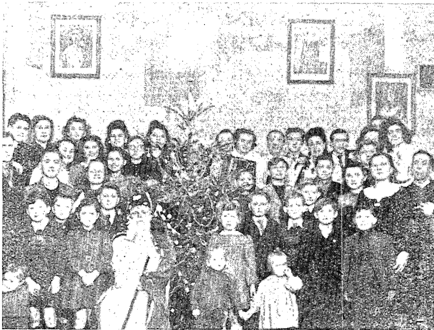
Kerstfeest (met links van de kerstboom ook Sinterklaas) voor de Poolse kinderen en hun ouders in Fontaine-l'Évêque, 1946 (Polska Dzisiejsza, 23.02.1947,)