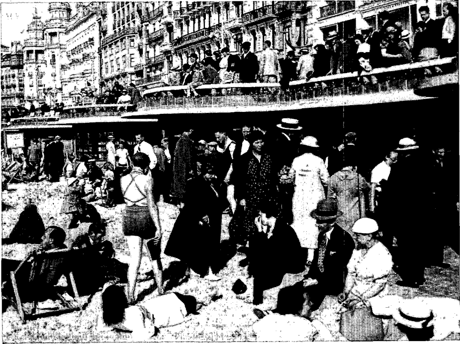
Kusttoerisme werd door de kerk als onzedig beschouwd vanwege het gemengd zwemmen en de onmogelijkheid tot religieuze controle op de vakantiegangers