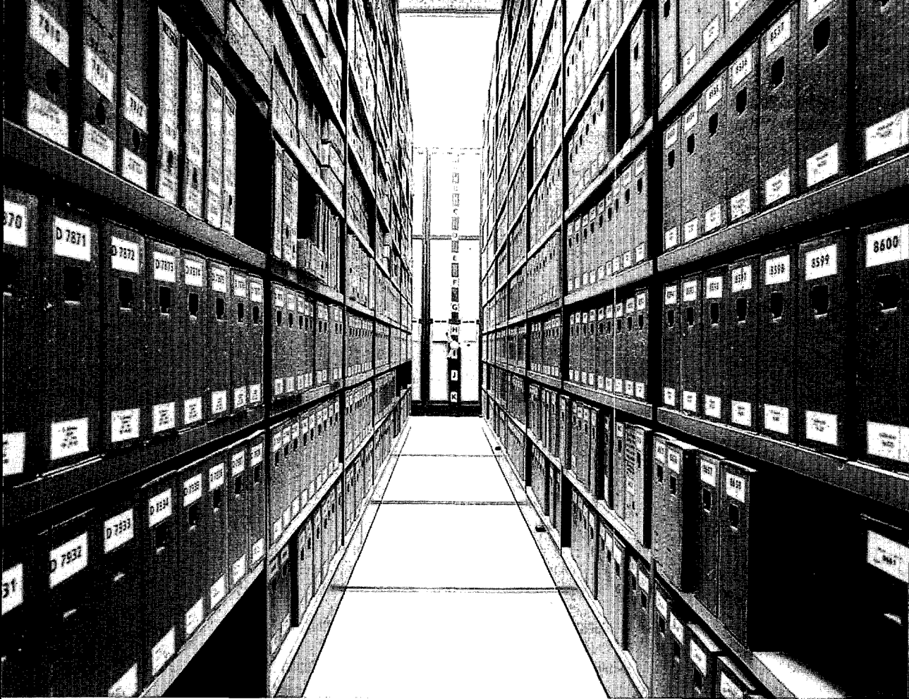
De compactuszaal van het Archief en Documentatiecentrum voor het Vlaams-Nationalisme (ADV)