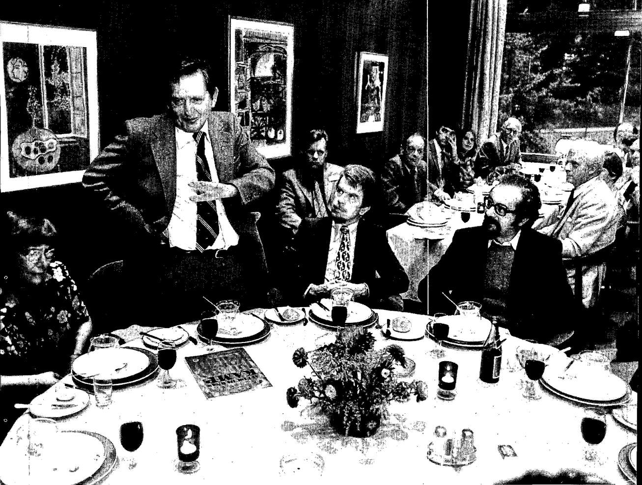
Olof Palme, toen voorzitter van de Zweedse sociaal-democraten, op een IALHI-meeting in 1980 in Stockholm