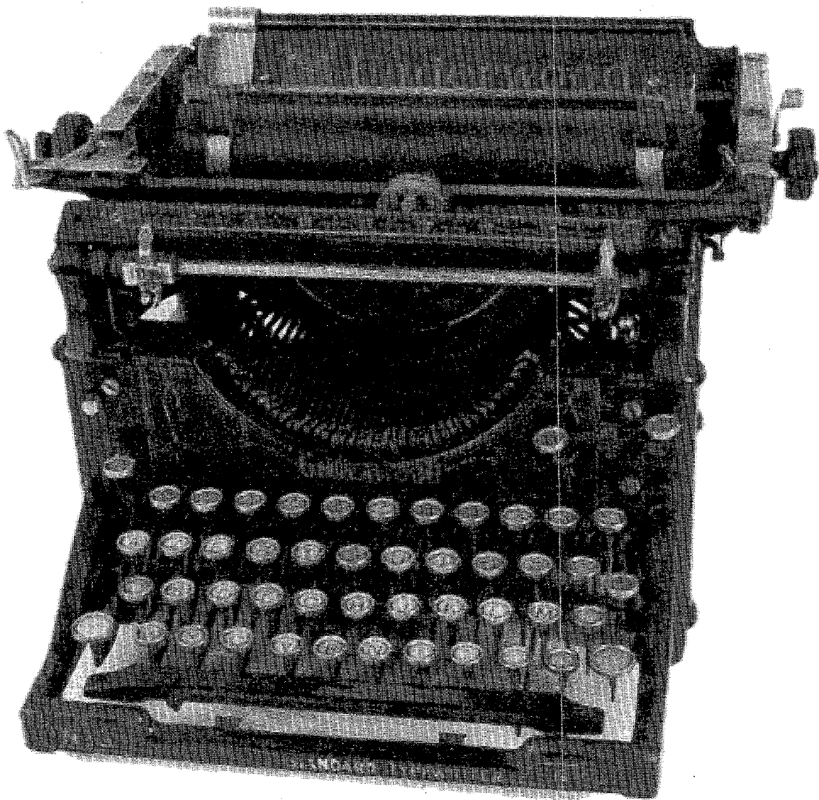
Schrijfmachine van Maurice Gilliams (Letterenhuis)