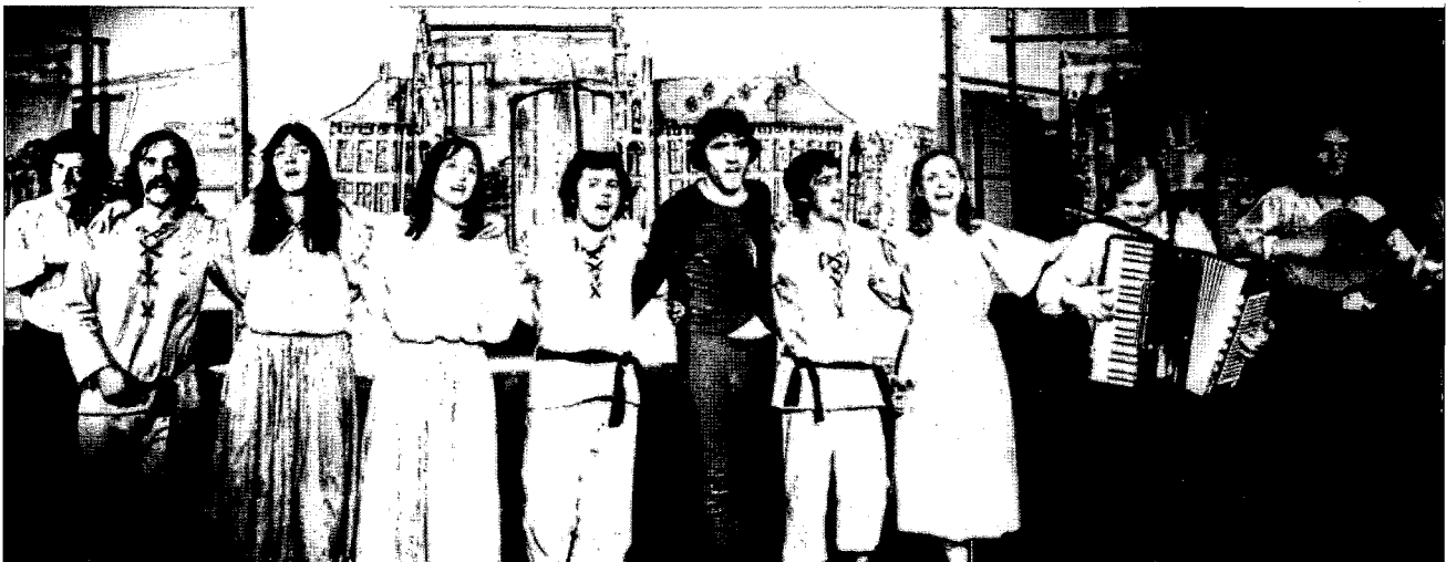
Het Kollektief Internationale Nieuwe Scène, een van de belangrijkste alternatieve theatergezelschappen

Kultureel Front dat in zijn beginjaren (1969-1970) voornamelijk in Nederland actief was rond de subsidiestrijd voor politieke theaters. Het KfV zal het Nederlandse Front in ledenaantal snel overvleugelen. Het ging dan ook meer autonoom werken met vanaf 1974 een eigen secretariaat. Niet alleen het aantal leden steeg, maar ook de verscheidenheid werd groter met professionele- en amateurtheaters, filmproducenten en -verspreiders, kindertheaters, poppenkasten, tijdschriften, zangkoren, muziekgroepen, uitgevers en drukkers, grafische collectieven. Voor de belangrijkste disciplines voorzagen het KfV specifieke werkgroepen waarin de specifieke belangenverdediging en de vorming werden georganiseerd.