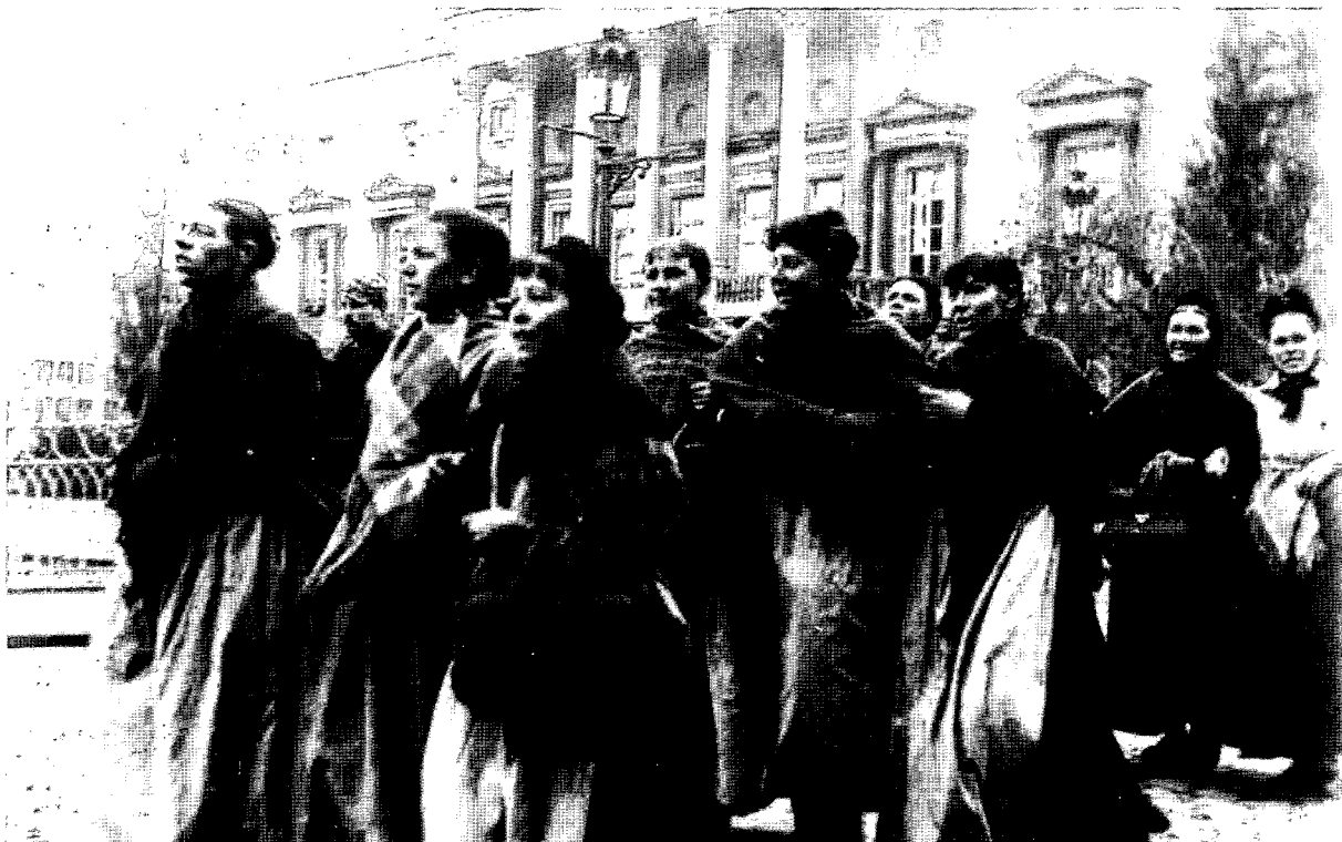
De staking van 1893, Justitiepaleis Gent