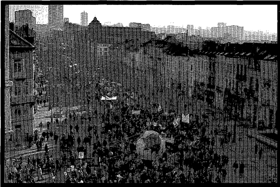
Antiglobalistenbetoging, Brussel, 14 januari 2001

houding ook niet veranderen. De troost van de geschiedenis is dat niets eeuwig is, hoe sterk de ‘pensée unique’ nu nog kan zijn. Dit betekent ook niet dat het idee zomaar moet losgelaten worden. Er dient immers onderstreept te worden dat de deelname van alle landen géén noodzakelijke voorwaarde is voor het succes van de taks. Heikki Patomäki suggereert dat de taks geïntroduceerd zou worden door de Europese Unie of enkele gelijkgestemde landen die zouden optreden als internationale avant-garde. (29) Via een internationale Tobin Taks Organisatie zou de taks gedirigeerd worden en de inkomsten ervan beheerd en verdeeld. Dirk Van der Maelen wijst erop dat het fiscaal mechanisme uit het huidige wetsvoorstel is gebaseerd op de Europese BTW-richtlijn die internationaal erkend wordt als een moderne en efficiënte fiscale heffing die intussen is overgenomen door 80 landen. (30) Daardoor wordt de taks makkelijker exporteerbaar. De vraag blijft dus of er politieke wil is om bovenstaande projecten te realiseren.