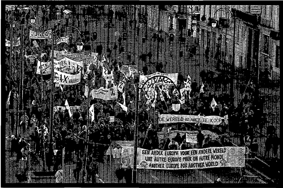
Antiglobalistenbetoging, Brussel, 14 januari 2001

inderdaad aantrekkelijk lijken te zijn voor arbeidsintensieve sectoren wegens de vermelde concurrentiële 'voordelen'. De regeringen uit de industrielanden ontlopen echter hun verantwoordelijkheid wanneer zij zich verschuilen achter de 'delokaliserende lokroep uit het Zuiden' om hun onmacht aan te kaarten.