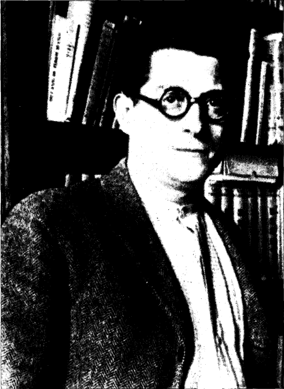
Andreu Nin, een van de grote leiders van de POUM, vermoord tijdens de Spaanse burgeroorlog