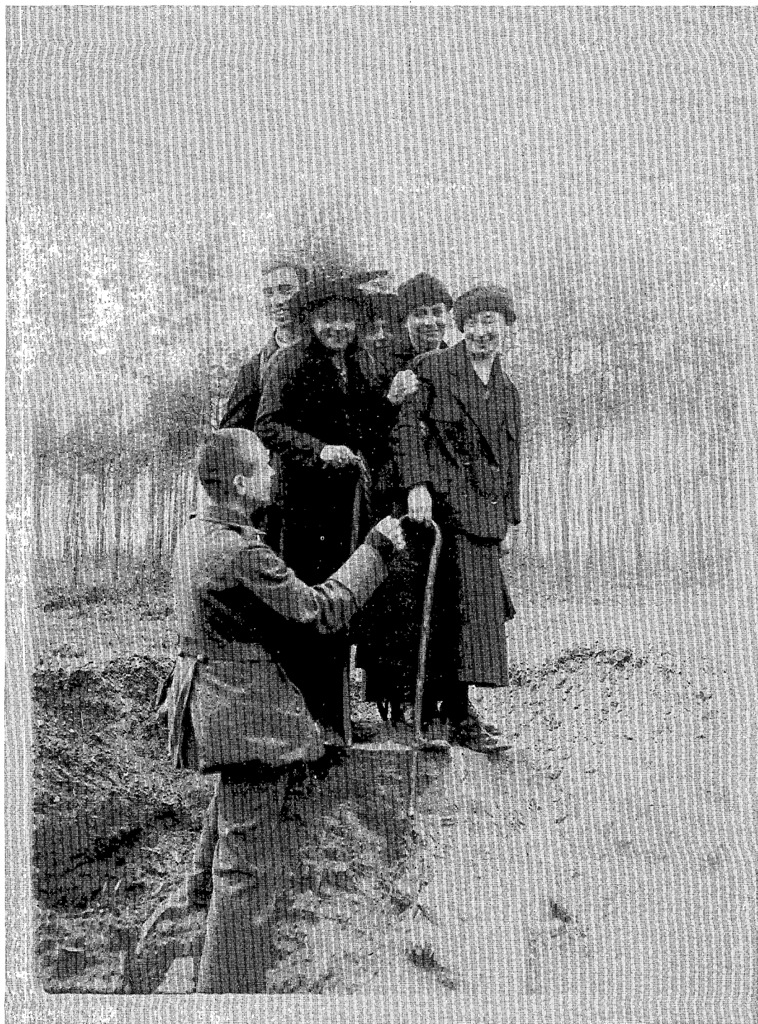
De Goede Tempeliers op stap in Latem, ca. 1917