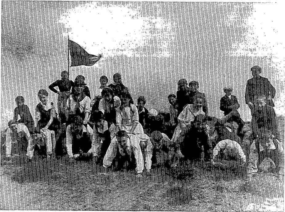
De kindergroep van de Goede Tempeliers aan zee

den zij zich bereid een autoritaire politiek te voeren. (43) Kort voor het uitbreken van de Eerste Wereldoorlog promoveerde Minnaert bij Mac Leod op plantenfysiologie.