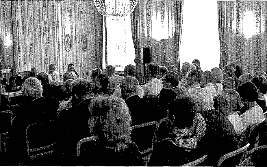
Een sterk geïnteresseerd publiek in de plechtige zaal van het Erverrahuis