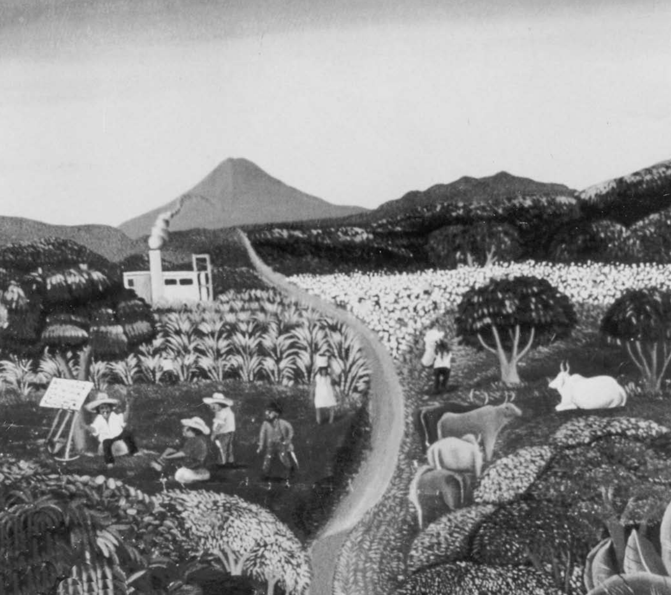
Detail uit een affiche van Oxfam-Wereldwinkels, jaren 1970