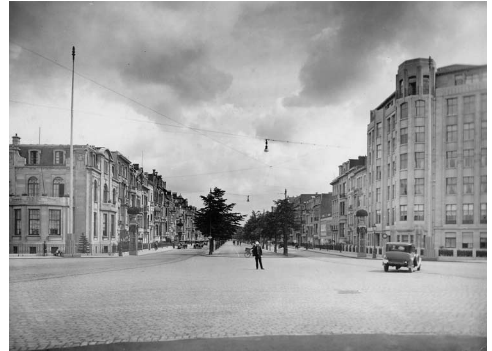
De Jan Van Rijswijcklaan in Antwerpen. De naamgeving was een beslissing van de gemeenteraad, daags na zijn overlijden. Het duurde wel 30 jaar voor de laan die door de gedeklasseerde omwalling liep, klaar was.

Zijn Vlaamsgezindheid bond het taalrespect voor het Nederlands aan de politieke en sociale emancipatie van de Vlamingen. Die idee vond, opmerkelijk, in de liberale partij in Antwerpen, meer en sterker overtuigde aanhangers in de Liberale Volkspartij (LVP) dan in de gezapige Liberale Vlaamse Bond, waar het conservatisme zich mettertijd nestelde. In de LVP, de liberale arbeidersvleugel, die geen deel wilde uitmaken van het Belgisch Liberaal Werkersverbond, werd sociaal en Vlaams radicalisme de regel. Nog voor de