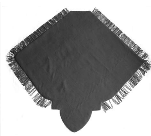
Voor en na de restauratie