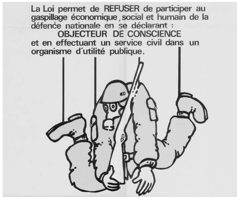
Affiche van het Centre d'information sur le désarmement et l'objection de conscience (C.I.D.O.C), ongedateerd