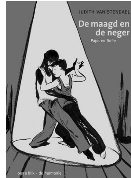
Cover van het boek van Judith Vanistendael, De maagd en de neger , een beeldverhaal over verliefdheid en de asielzoekersprocedure in België (© Judith Vanistendael)

De herstructurering van de integratiesector en de uitwerking van een beleid voor etnisch-culturele minderheden werd door het Vlaams Parlement bepaald in het Minderhedendecreet van 28 april 1998. Ook de ontwikkeling van een opvangbeleid voor mensen zonder wettig verblijf, kreeg aandacht in het decreet. Deze beslissing had een dubbel effect: enerzijds moest de Steunpuntwerking een plaats krijgen in het nieuw op te richten Vlaams Minderhedencentrum (VMC), anderzijds zouden de integratiesector, de particuliere organisaties en