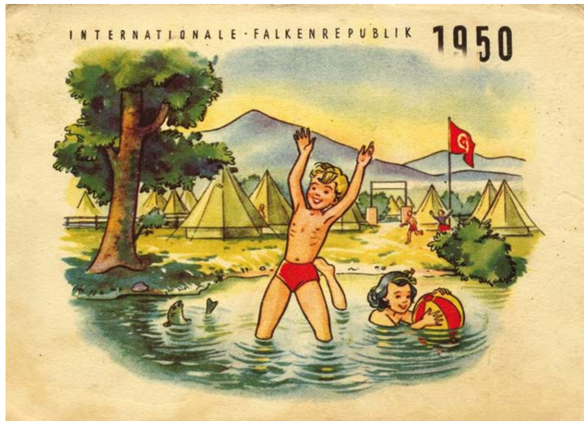
Boven: Prentbriefkaart uitgegeven n.a.v. het internationale Rode Valkenkamp in Oostenrijk, poststempel 22 augustus 1950

In 1924 werd de Socialistische Jonge Wachten omgevormd tot het Arbeidersjeugdverbond dat jongeren boven de 16 jaar groepeerde. In 1929 werd de Rode Valken gesticht, die zich richtte tot kinderen jonger dan 16 jaar. Vanaf 1929 vormden de Jonge Wachten en de Rode Valken samen de Arbeidersjeugdcentrale (AJC). De AJC had tot doel de arbeidersjeugd op te voeden en te ontwikkelen. Het socialistisch cultuurideaal werd gerealiseerd via traditionele omgangsvormen, zonder drank en tabak, en met lichaamsbeweging, volksdans, muziek en lekenspel. In 1937 werden alle socialistische jongerengroepen verenigd in de Socialistische Arbeidersjeugd Vlaanderen.