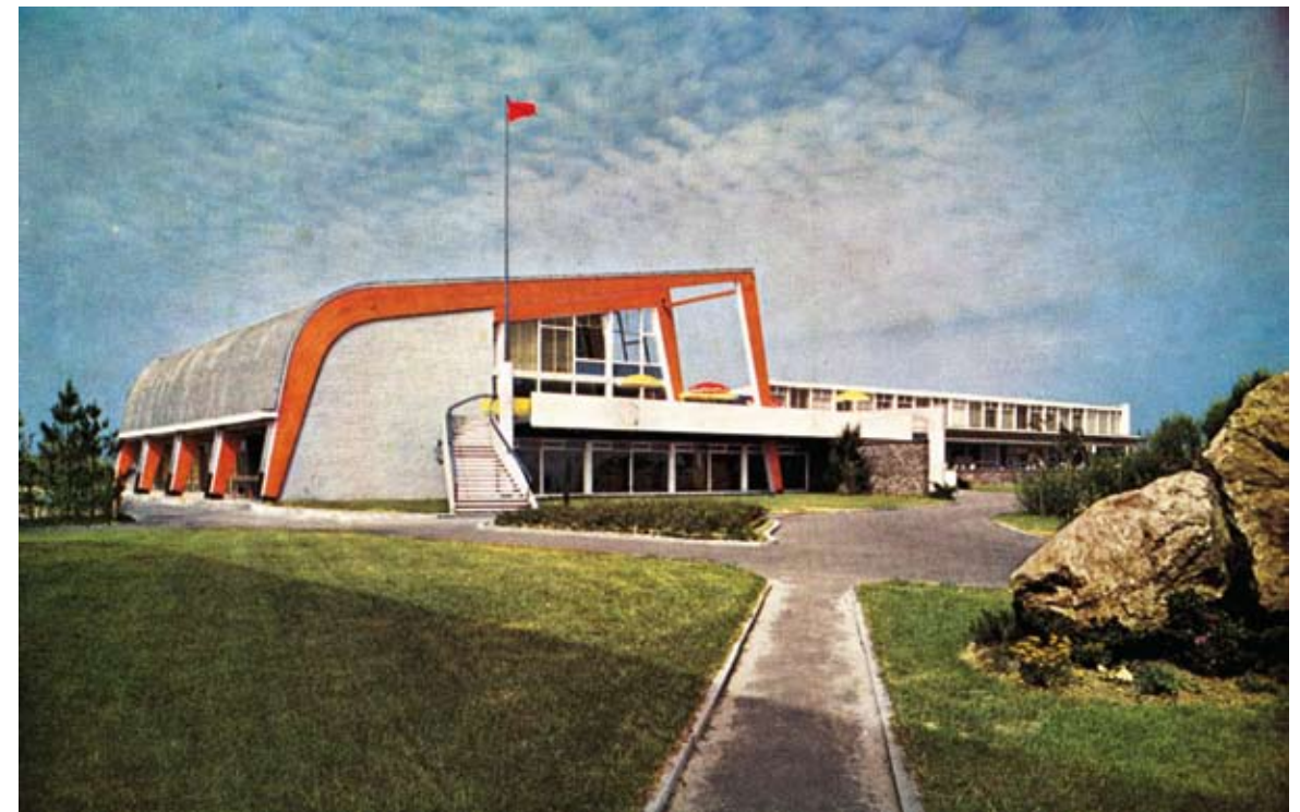
Linkerpagina: Prentbriefkaart uitgegeven n.a.v. 1 mei 1957

De jaren 50 stonden internationaal in het teken van de Koude Oorlog en de wapenwedloop tussen de VS en de USSR. De socialistische beweging zette naar aanleiding van het Feest van de Arbeid in 1957 haar standpunt over een eventuele atoomoorlog nog eens in de verf.