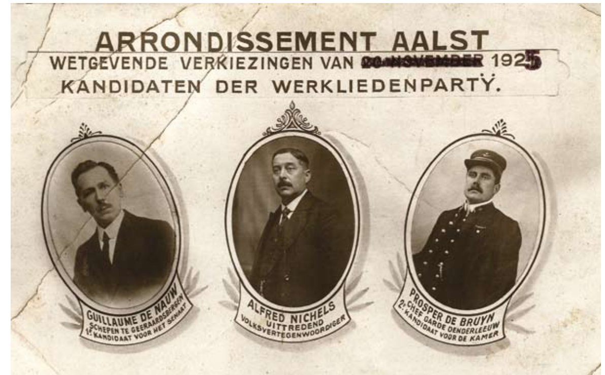
'Gerecycleerde' prentbriefkaart, eerst uitgegeven voor de wetgevende verkiezingen van 20 november 1921, opnieuw gebruikt voor deze van 5 april 1925

De Vrijdagmarkt is al sinds de Middeleeuwen het kloppend hart van Gent. Elk bewind liet hier sporen na (symbolen of monumenten). Rond 1900 besloot de socialistische beweging er een waarachtig 'paleis' te bouwen. Ons Huis werd het epicentrum van het Gentse socialisme. Tot op vandaag zijn de loketten van Bond Moyson en de kantoren van het ABVV er gehuisvest.