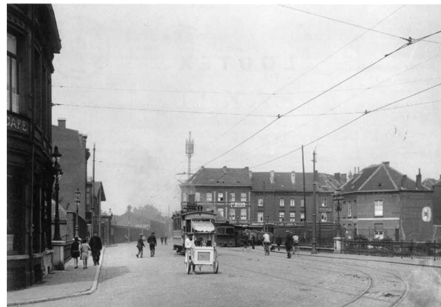
Zicht op het Griendeplein met nog duidelijk zichtbaar de brug over de verbindingsvaart tussen de Rabotoren en de Brugse Vaart (uit: B. DE WILDE, Gent/Rabot. De teloorgang van de textielnijverheid )

De Rabotwijk beleeft met de inplanting van het nieuwe justitiepaleis, de KaHo-campus en het project Bruggen naar Rabot , zijn kantelmoment. Historicus Bart De Wilde achtte de tijd rijp om een historisch overzicht te maken van de buurt vanaf 1860 tot de teloorgang van de Gentse textielnijverheid rond 1980. De publicatie is een onderdeel van het Memory On/Off -project dat het Masereelfonds in 2005 lanceerde rond de impact van het verdwijnen van de tex-