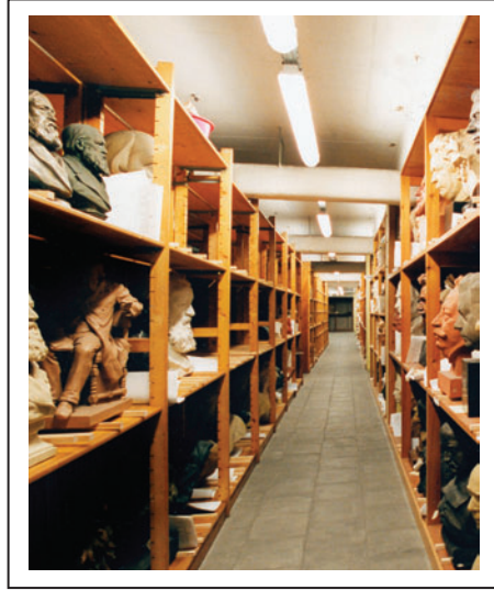
Het beeldendepot in het Letterenhuis

gedrukte klapper wordt in 1985 vervangen door een geautomatiseerde versie. Vanaf 1996 is informatie over de collectie te vinden in de databank Agrippa.