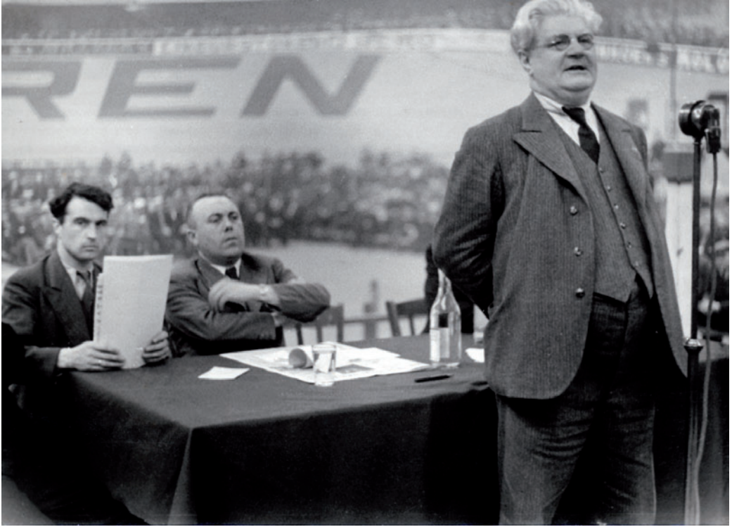
Edo Fimmen (r.) in het Sportpaleis in Antwerpen tijdens de staking van juni 1936. Helemaal links zit Louis Major.

heden meer om in Duitsland zelf tegen het nationaalsocialisme te ageren. Medewerking met de Franse en Britse inlichtingendiensten – die er zelf ook alle belang bij hadden gegevens over Duitsland te vergaren en in geval van oorlog uiteraard geen Duitse overwinning wensten – kon een onrechtstreekse bijdrage vormen tot een Duitse nederlaag.