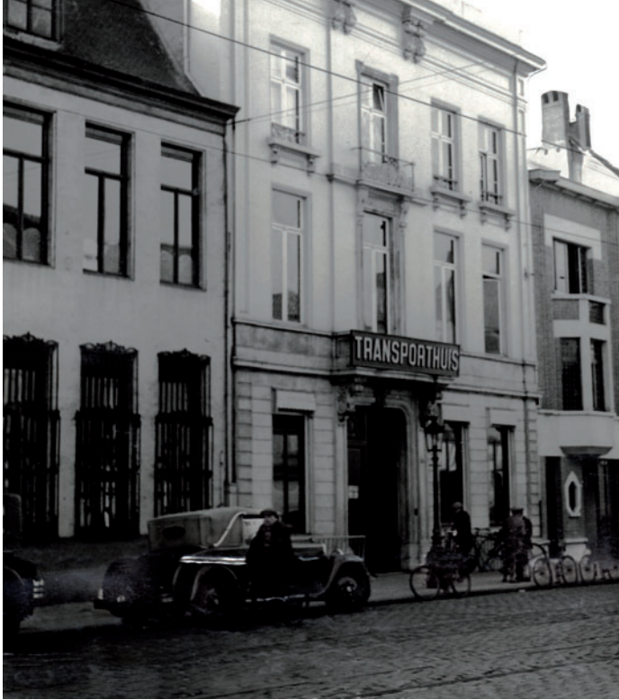
Het BTB-gebouw (m.) aan de Paardenmarkt te Antwerpen

werd meestal een andere, minder bekende kroeg opgezocht, waar publicaties en geld werden verdeeld en waar vaak ook politieke discussies werden gevoerd. Knüfken hechtte ook groot belang aan gegevens over scheepsladingen, scheepsroutes, aan de politieke gezindheid van matrozen en andere zeelieden, de materiële omstandigheden aan boord (eten of tekort daaraan, bijvoorbeeld). Een van de cafés die het best bekend waren bij ITF-leden, was Roter Sand, Veemarkt 3. Het werd tot eind 1938 uitgebaat door Anna Kaiser, beter bekend als 'tante Anna', die onder Duitse emigranten heel populair was. Toen een zestal leden van de ITF-groep in Spanje vochten, stuurden zij hun post naar dit adres. Enkele medewerkers van Knüfken logeerden er enige tijd. Dit café, evenals de reeds genoemde cafés De Bierstal en de Portugese Kelder, stond op de lijst van kroegen die om politieke redenen voor Duitse zeelieden verboden waren – een lijst die door het Duitse consulaat-generaal in Antwerpen was aangelegd en regelmatig werd herzien. 4