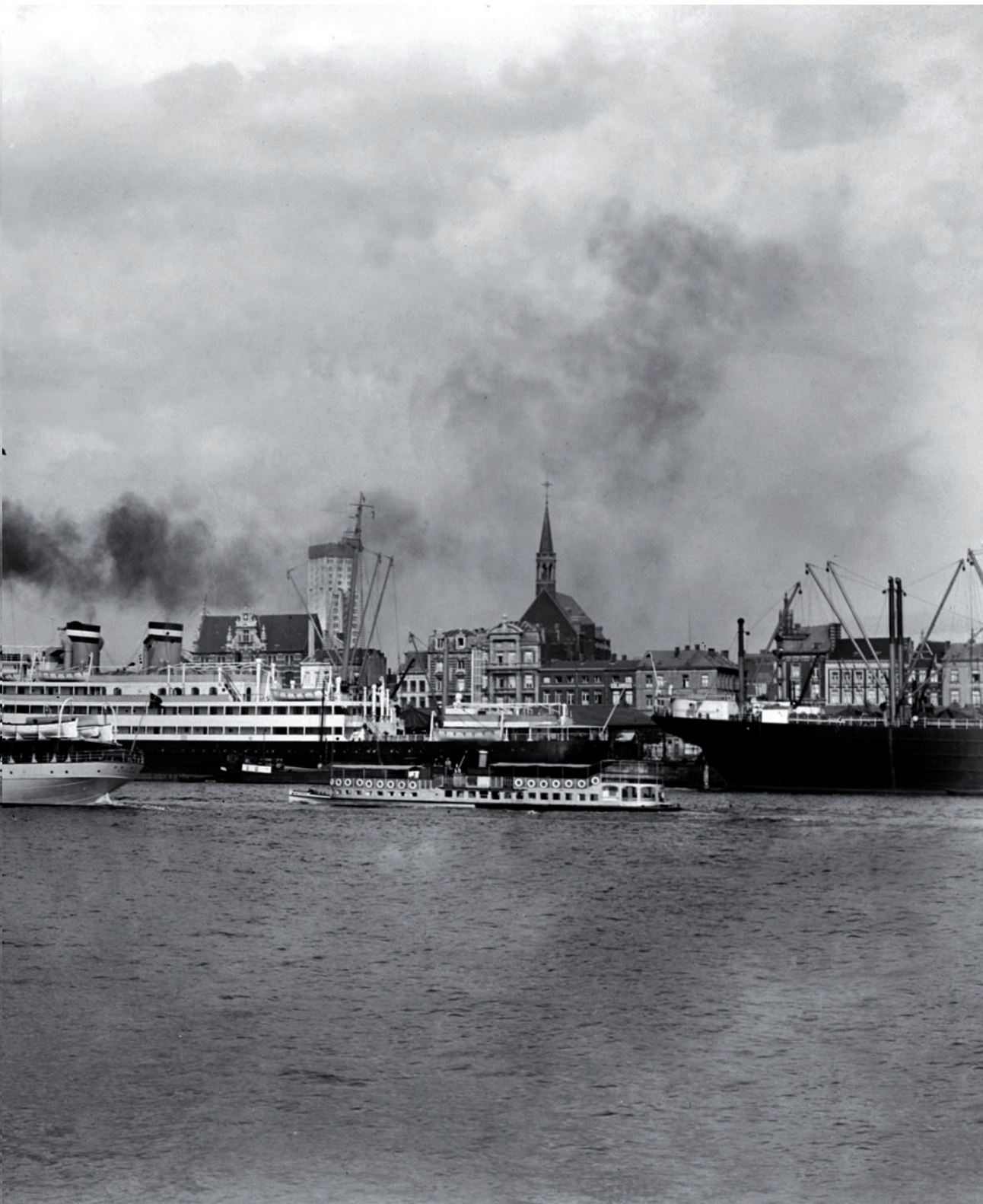
De Scheldekaaien tussen 1928 en 1930. Hier meerden de schepen aan, waarop de mannen van de ITF voeren (Gemeentelijk Havenbedrijf Antwerpen)