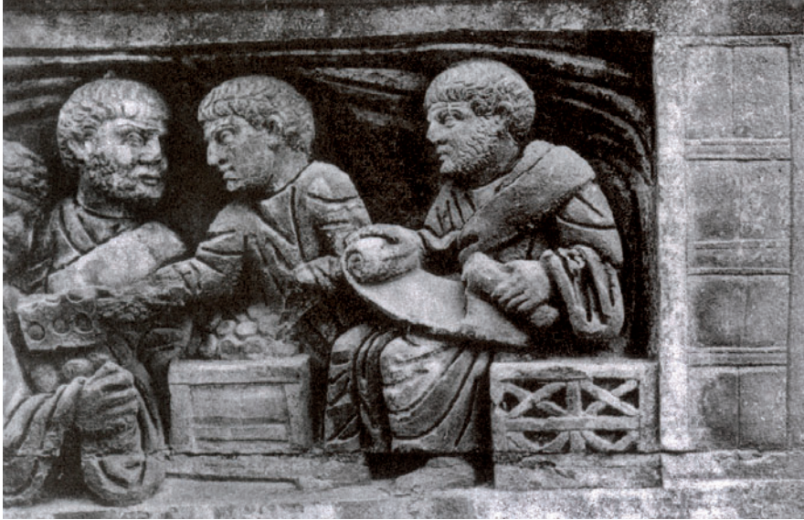
Bas-reliëf op de triomfboog van Constantijn De Grote (315 AC) in Rome met de voorstelling van een muntenverdeling of congiarium (uit: J. LUCASSEN, Global Comparisons from Antiquity to the Twentieth Century , p. 96)

bronnen voorhanden om het ontstaan en de verspreiding van loonarbeid te (re)construeren. De mate waarin werkgevers geld nodig hadden om hun werknemers te betalen, lijkt dan de centrale vraag te zijn die duidelijk een verband legt tussen loonarbeid en het type munten dat binnen een welbepaalde tijdruimtelijke context in omloop gebracht werd en in omloop was (p. 9).