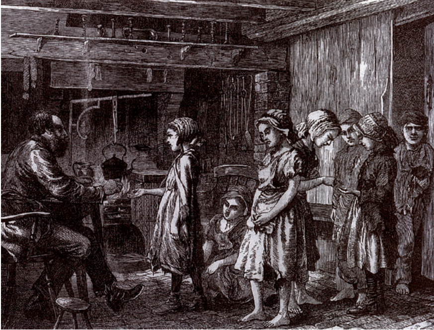
Collectieve uitbetaling van kind-arbeiders van een steenbakkerij in Engeland, 1871 (uit: J. LUCASSEN, Global Comparisons from Antiquity to the Twentieth Century , p. 11)

In het Westen werden de Griekse munten vervangen door Romeinse, in verschillende eenheden en metalen, met ook hier de nadruk op het gebruik ervan voor de uitbetaling van militairen (één denarius als tweedaags loon). Betrouwbare gegevens ontbreken om het gebruik van geld te bewijzen buiten de militaire context, maar toch wordt ervan uitgegaan dat slavenarbeid op het platteland gecombineerd werd met 'vrije loonarbeid' (Van Heesch, hoofdstuk 3). Voor het Oost-Romeinse Rijk zijn er evenmin voldoende gegevens voorhanden om loonarbeid te kunnen koppelen aan geldcirculatie en wordt er opnieuw verwezen naar zeelui en militairen om de verspreiding van zilvermunten te kunnen verklaren. In de steden werden ongeschoolde arbeiders dan weer uitbetaald in kopermunten. Deze verdwenen samen met het Romeinse Rijk en dit bleef, volgens de auteurs (die daarvoor Epstein citeren), niet zonder gevolgen, aangezien loonarbeid zogezegd niet kan bestaan zonder een overvloed aan munten. Deze stelling bewijst vreemd genoeg zichzelf door de afwezigheid van loonarbeid in Karolingisch Europa.