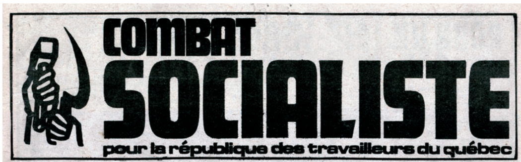
Links en rechts: hoofdingen van radikaal-linkse kranten in Québec, jaren 1970.

nen syndicalisten actie te voeren voor de vestiging van een verzorgingsstaat. Het 'duplessisme' bleek niet te kunnen optornen tegen de hernieuwde acties voor meer sociale rechtvaardigheid en gelijkberechtiging van de twee verschillende communautaire gemeenschappen. De christelijke arbeiderszuil scheurde zich af van zijn integristische roots; nieuwe koepelorganisaties zoals de Fédération des Unions Industrielles du Québec (FUIQ) werden uit de grond gestampt om de levensbeschouwelijke tegenstellingen te kunnen overstijgen. In 1957 werd een federatie opgericht om de centralisatietendens te bekrachtigen, de Fédération des Travailleurs du Québec (FTQ). Tijdens deze periode van herbronning besloten de vakbondsleiders om een politieke vertaling voor dit succes te vinden. In 1961 werd de oude sociaal-democratische Co-operative Commonwealth Federation (CCF) onder druk gezet om zichzelf te ontbinden in een nieuwe partij, de New Democratic Party (NDP). 3 Maurice Duplessis, gestorven in 1959, had ondanks een harde repressie de syndicale storm niet kunnen bedwingen. Een nieuwe tijd brak aan.