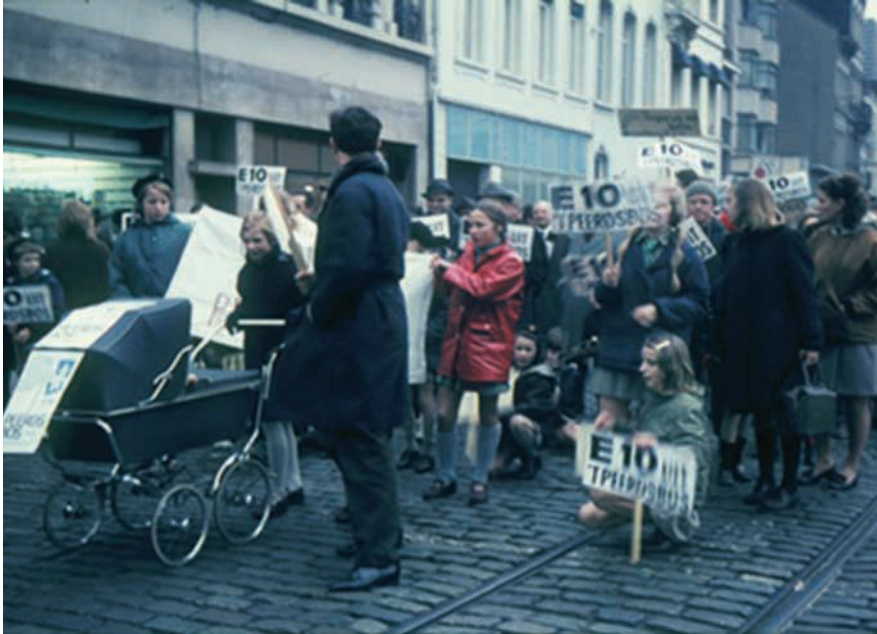
Protest tegen de aanleg van de E10, Antwerpen, 1969

leefomgeving, ook wel het NIMBY-fenomeen (Not In My Backyard) of LULU-fenomeen (Locally Unwanted Land Use) genaamd. De eerste acties in Vlaanderen zijn hier een duidelijk voorbeeld van. Zo werd er geprotesteerd tegen de aanleg van de autosnelwegen E10 en A24 door respectievelijk Brasschaat en Limburg, tegen de aanleg van het duwvaartkanaal Oelegem-Zandvliet of lokale industrieverontreinigingen zoals bij Bayer-Rickmann in Brugge of Metallurgie te Hoboken. 15