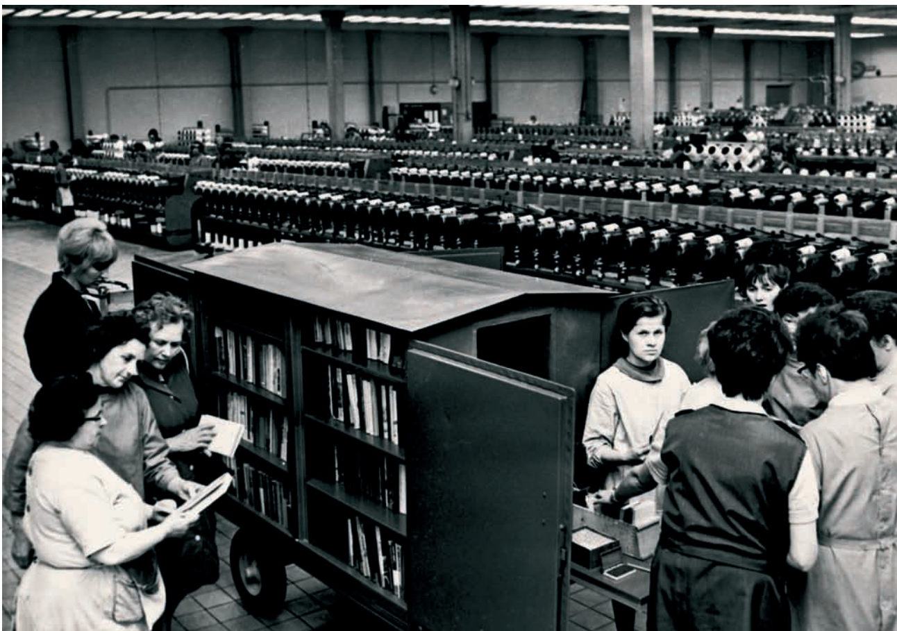
Boven: bibliotheekwagen in een chemiefabriek in Wilhelm-Pieck-Stadt Guben Links: heruitgave van het 39-delige verzameld werk van Marx en Engels