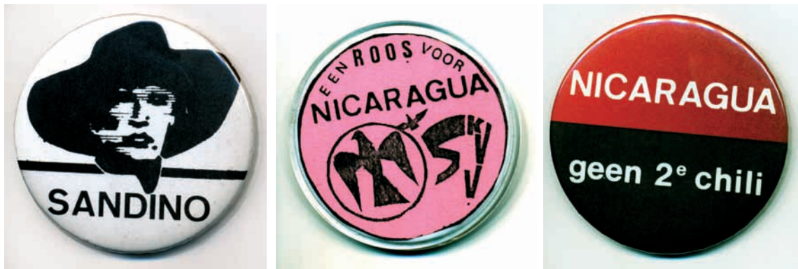
Badges voor Nicaragua (Amsab-ISG)

reden voor ballingschap. De Nicaraguaanse vaandeldragers verdwenen dus geleidelijk uit de Nicaraguabeweging. Voor comités die haast exclusief door Nicaraguaanse activisten werden gedragen, leidde dat onvermijdelijk tot het einde van de werking, op die manier verdwenen bijvoorbeeld het voordien zeer actieve comité van Barcelona en de twee eerste comités van Parijs van de kaart. 17 Voor de Nicaraguacomités in België waren er echter minder organisatorische problemen en was er eerder sprake van een bemanningswisseling. Doordat de comités in België van meet af aan aansluiting en verruiming hadden gevonden bij andere segmenten van de derdewereldbeweging, stonden er na de revolutie activisten ter beschikking die de Nicaraguaanse comitéleden konden aflossen. Het aandeel van leden en militanten van de socialistische vakbond was niet gering, hoewel de solidariteitscomités een breed links spectrum aantrokken. 18