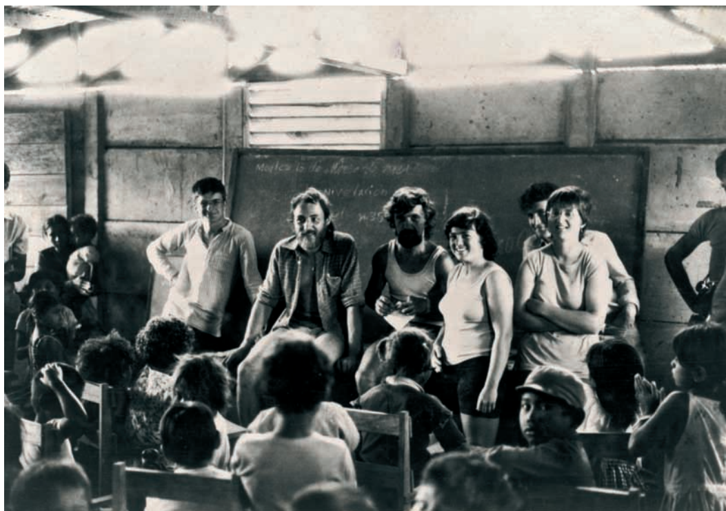
Verwelkoming van Vlaamse brigadisten in de school van La Estancia

principes van politieke solidariteit, gaven de comités financiële en morele steun aan de verkiezingscampagne van het FSLN. In tegenstelling tot de verwachtingen, waren de verkiezingen een nederlaag voor het FSLN onder leiding van Daniel Ortega en een overwinning voor de door Violeta Chamorro geleide Unión Nacional Opositora (UNO), een antisandinistische coalitie van diverse oppositiepartijen die kon rekenen op de steun van de Verenigde Staten. Voor het FSLN braken woelige tijden aan en in de moeilijke fase van de machtsoverdracht kwamen ernstige interne spanningen naar boven. Ook voor de solidariteitscomités in het buitenland was de verkiezingsnederlaag van het FSLN een zware klap. Hoewel de Belgische comités in een eerste reactie op de verkiezingsuitslag lieten weten dat na deze nederlaag hun solidariteit en steun aan het FSLN niet zou verminderen, was de ontgoocheling bij de achterban groot en er werden in de eerste maanden na de verkiezingen vele analyses gemaakt over de oorzaken en gevolgen van het einde van meer dan tien jaar sandinistisch bewind. Na de ontgoocheling van de verkiezingsnederlaag kwamen er met de interne twisten binnen het FSLN en met de manier waarop de partij haar materiële belangen trachtte te verzekeren nog meer deuken in het morele prestige van het Frente. 51 Meer nog dan morele factoren zoals ontmoediging en ontgoocheling, was de desin-