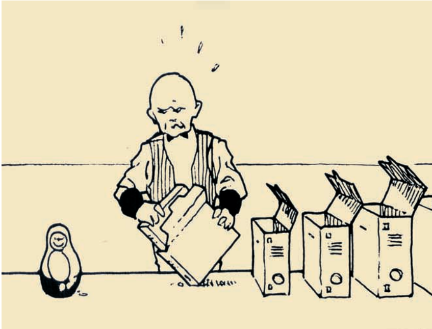
Russische archieven. Cartoon van Stef Binst

Dit verhaal en de door Somerhausen opgediepte documentatie wijzen vooral op het potentieel aan socialistica dat toen in ons land beschikbaar was.