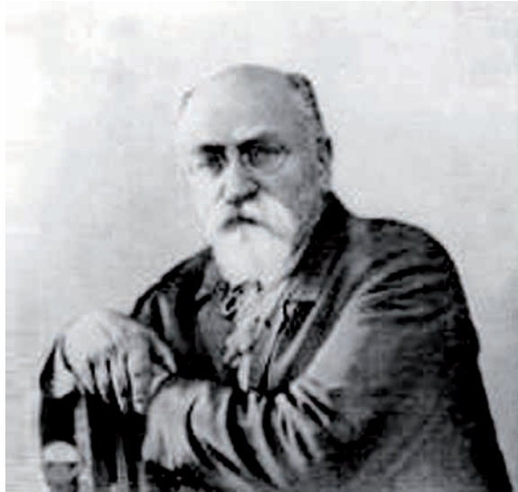
David Rjazanov (1870-1938), de eerste directeur van het Marx-Engels Instituut te Moskou