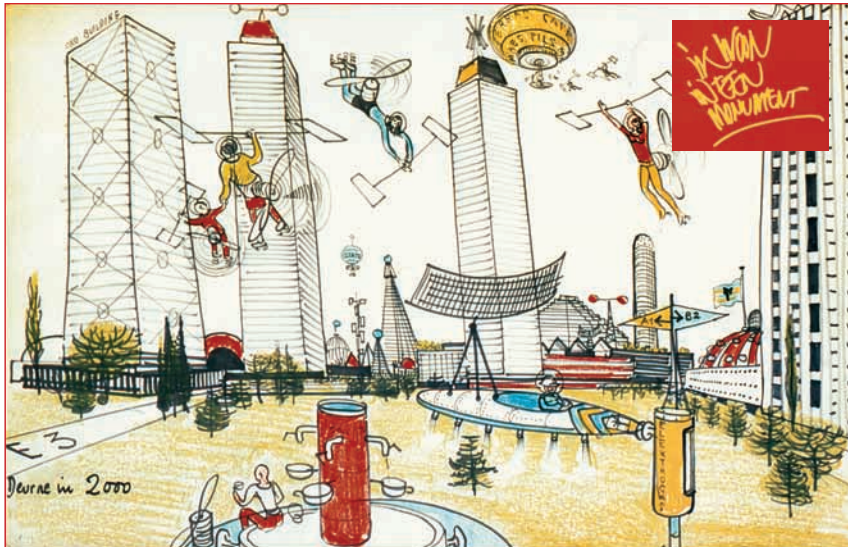
Campagnebeeld van het project Ik woon in een Monument , gebaseerd op een ontwerp van Renaat Braem

de buurtbewoners bij een dergelijk initiatief konden betrekken en hoe we de valkuil van de stigmatisatie konden vermijden in wijken waar 38 procent van de inwoners op het Vlaams Blok had gestemd. We opteerden voor het verzamelen van mondelinge getuigenissen bij de bewoners.