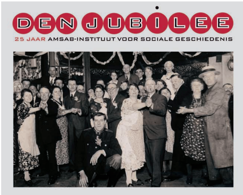
Programmaboekje van Den Jubilee!

ken, maar we willen de aandacht vestigen op enkele initiatieven binnen dit project die goed illustreren wat Amsab-ISG wilde communiceren bij deze viering. Met name de verbreding van het werkterrein en het vernieuwende karakter van zijn erfgoedinitiatieven.