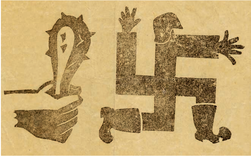
Campagnebeeld van het project Tegendruk , gebaseerd op een vlugschrift van het Onafhankelijkheidsfront

Het opzet leende zich goed voor schoolgaande jeugd. De tentoonstelling belichtte immers thema's die tot op vandaag actueel zijn: persvrijheid, censuur, objectiviteit, etc. Om scholen aan te trekken, organiseerden we infomiddagen voor leerkrachten. Met deze methode krijg je echter slechts de echt gemotiveerden. Een educatieve map zou hier uitkomst gebracht hebben, maar ondanks herhaalde pogingen, vonden we hiervoor noch het geld, noch een partner.