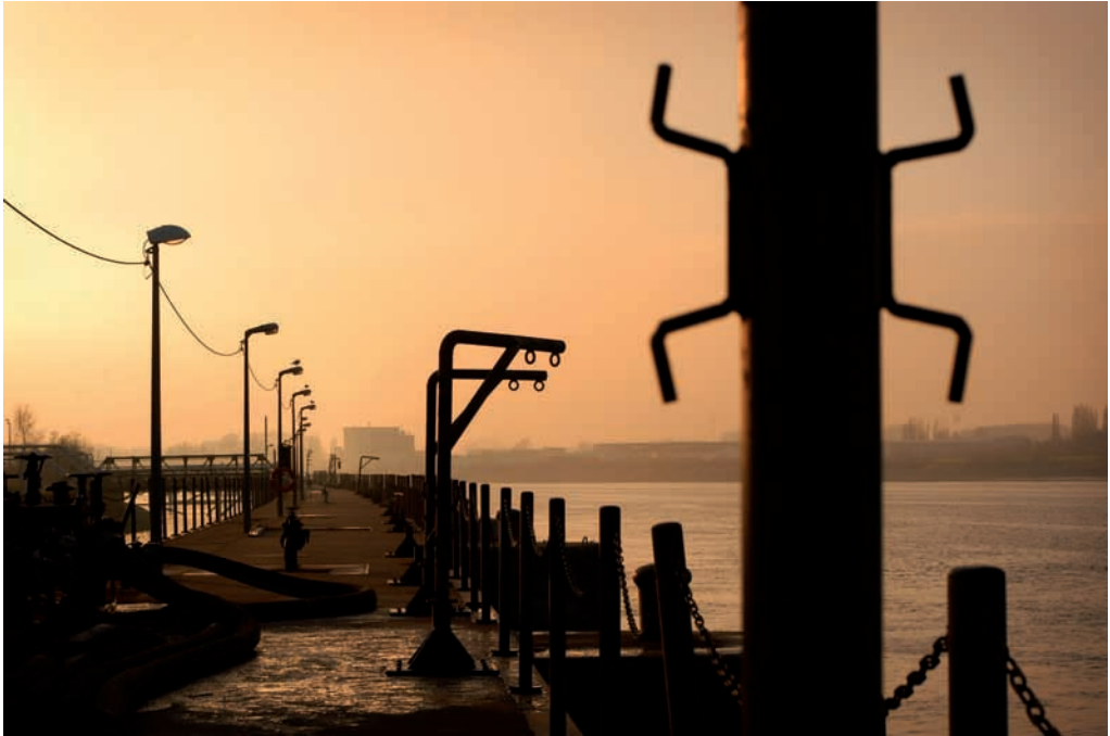
Zicht op Petroleum Zuid, de oude petroleumhaven van Antwerpen.

De terminus van lijn 13 was de ‘pyrotechnie’, de vuurwerkfabriek, in de volksmond de ‘Protteknie’. Van De Lijn mochten we bij wijze van sponsoring twee bussen gebruiken. Tijdens de busrit kregen de passagiers ook de voorstelling te zien. We kozen er bewust voor om in situ te werken, de beleving van het oude bedrijfsterrein, de petroleumgeuren, de geluiden van de overblijvende bedrijven wilden we koppelen aan wat de acteurs op de bus vertelden. Iedere halte hield verband met een verhaal dat verteld werd. Deze formule werd zeer gewaardeerd omdat alles zo in de juiste context werd gebracht. Nadeel ervan was dat er door het concept niet meer dan 40 personen per rit meekonden.