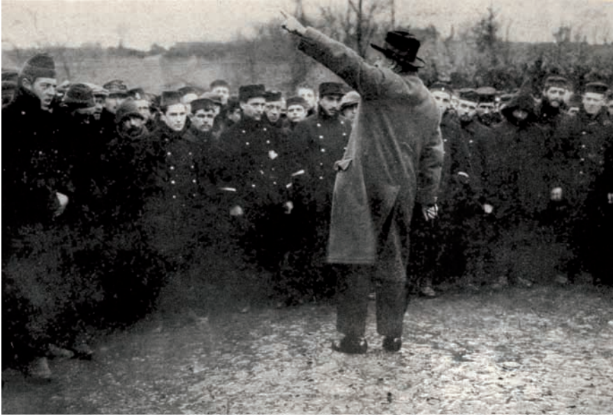
De socialist Emile Vandervelde spreekt als minister de troepen toe tijdens de slag om de IJzer, 1914. (uit: Emile VANDERVELDE, Souvenirs d'un militant socialiste , Parijs: Denoël, 1939)

te Antwerpen. Gewelddadige feiten grepen plaats tegenover Duitse handelaars, winkelzaken, cafés, kortom, tegen al wat Duits was. De Nieuwe Gazet beperkte, ter vergelijking, de commentaar door te zeggen dat er gelukkig (nog) geen mensenlevens te betreuren waren. 57 De Volksgazet daarentegen noemde de praktijken laf, sprak van een schande, van 'lage rassenhaat' zelfs, en meende dat wie wilde vechten maar naar de grens moest gaan in plaats van hier onschuldige mensen af te ranselen. 58