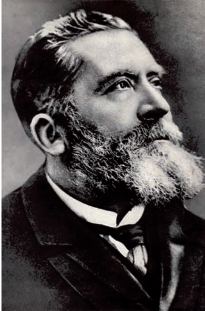
Artikel uit De Volksgazet , 02/08/1914