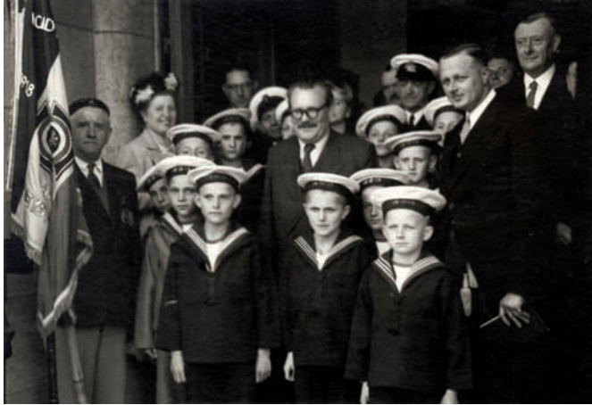
Achiel Van Acker (midden met bril) op bezoek in de IBIS-school (Amsab-ISG, Gent)

In 1993 kreeg Amsab-ISG het fotoarchief van Achiel Van Acker binnen. Deze collectie geeft een overzicht van zijn taken en werkzaamheden als politicus en minister, met foto's van verschillende regeringen, verkiezingscampagnes, reizen en officiële bezoeken. Het archief bevat ook een kleine collectie familiefoto's vanaf de jaren 1920.