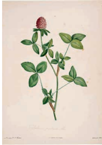
Titelpagina van een uitgave van Lettres sur la botanique uit 1805, met kleurenplaten van Pierre-Joseph Redouté (bron: http://www.botanicus.org/item/31753000809605 , laatst geraadpleegd op 04/06/2010)

de roes maar, zoals het in de mijns inziens zwaarder wegende passages aangeduid wordt, een 'passie'. De Bekentenissen zeggen in boek 12: 'De plantkunde, in de zin waarin ik haar altijd had opgevat en ze een hartstocht voor mij begon te worden, was precies de improductieve studie die geschikt was om de leegte van mijn vrije tijd te vullen om zo geen ruimte te laten aan de waanzin van de verbeelding noch aan de verveling van het totale nietsdoen. Achteloos door bossen en velden dwalen, werktuiglijk hier eens een bloem en daar weer een takje pakken, bijna bij toeval het land afstropen ... dat was een manier om de eeuwigheid door te brengen zonder me ook maar een moment te vervelen.' 36